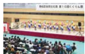
くくりん祭(文化祭)

※新型コロナウイルス感染症の影響により各種事業は中止、変更される場合があります。