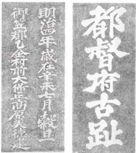
石碑の拓影(文化ふれあい館蔵)

背面には、「明治四年歳在辛未七月穀旦 御笠郡乙金城市乙金村前大保正高原美徳建」と彫