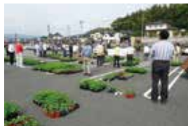
グリーンカーテン大作戦