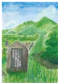
「歴史ある万葉歌ひ」