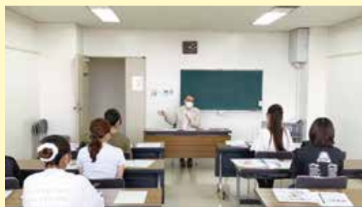
福岡女子短期大学の学生への講義(市役所で開催)