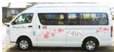
まほろば号地域線