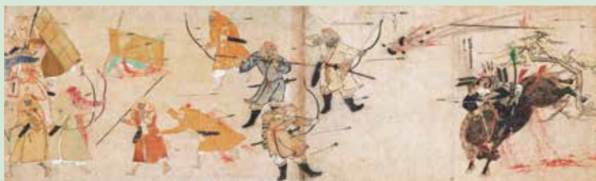
「蒙古襲来絵詞」(前巻 部分)。鎌倉時代13世紀、宮内庁三の丸尚蔵館。 この場面の展示は8月9日まで。8月11日～29日は後巻を展示。

なお、この合戦で沈没したモンゴル軍船が、長崎県松浦市の沖合で発見されました。特別展チケットで入場できる文化交流展(平常展)では、海底から発見された関連遺物を展示しています。