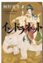
『インドラネット』 桐野夏生 KADOKAWA