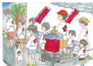
「梅香苑子どもみこし夏まつり」