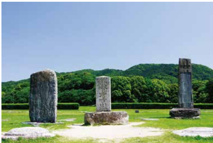
正殿に立つ3基の顕彰碑(中央が「都督府古趾碑」)

皆さんも見慣れているこの景色、この場所(特別史跡大宰府跡)は、大正3(1921)年に国史跡に指定されてから本年度で100年を迎えました。今回は、大宰府政庁跡の正殿跡に建っている大宰府跡を顕彰する3基