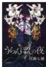
『うらんぼんの夜』 川瀬七緒 朝日新聞出版