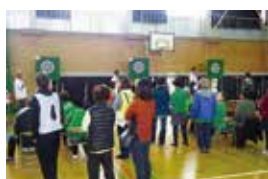
防災炊き出し訓練ダーツ大会