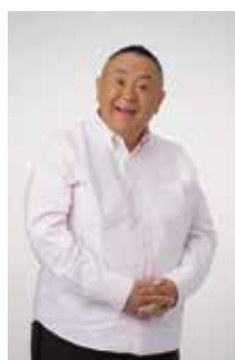
まつむらくにひろ 松村邦洋