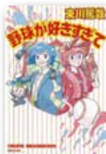
『野球が好きすぎて』 東川篤哉 実業之日本社

●新型コロナウイルス感染拡大防止のため、来館の際はマスク着用などのご協力をお願いします。