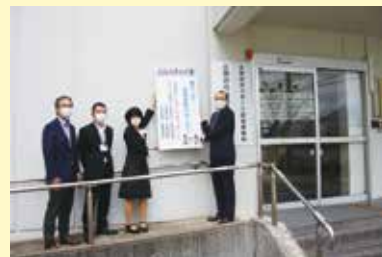
「にしのみどぐち」オープン!

なお、10月20日からはマイナンバーカードをお持ちの方々がコンビニエンスストアでも各種証明書を発行できるサービスもスタートする予定です。