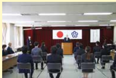
辞令交付式の様子