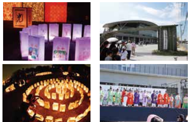
以前の様子(左:古都の光、右:市民政庁まつり)

例年秋に開催していましたが「太宰府 古都の光」、「太宰府市民政庁まつり」は、新型コロナウイルス感染症の影響を踏まえ、実行委員会での協議の結果、まつり準備の都合や協賛の状況を考慮し、昨年度に引き続き中止と決定しました。 毎年多くの市民の皆さんに来場してもらい、楽しみにしていた皆さんには申し訳ありませんが、理解いただきますようお願いいたします。