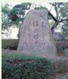
山上憶良の碑 場所:太宰府市役所