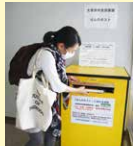
ポストを利用する様子

意見していただいた市民の方は、「市民の声にスピーディーにこたえてくれてありがたい。便利にかつ安心安全に利用できてうれしい」と述べ、最初の利用者となりました。今後も市民のみみなさまの声に可能な限り迅速に柔軟にこたえていけるように、市をあげて努力していきます。