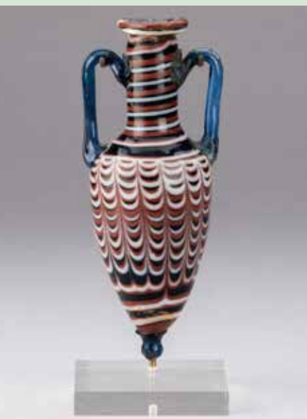
アンフォリスコス (東地中海沿岸域、紀元前2-前1世紀、岡山市立オリエント美術館)

こうした美と技の世界は、いまでは名前も伝わらない古代の技術者によって実現したものでした。彼らの熱意と工夫に想いを馳せながら、古代ガラスの美しさをご堪能ください。