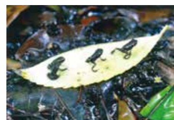
市民遺産第16号 「宝満山のヒキガエル」 毎年、宝満山のふもとの池で生まれたヒキガエルの子が山登りをしています。