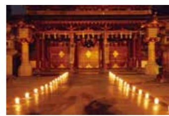
市民遺産第2号「八潮の千燈明」 江戸時代後期から続く五条区の伝統行事で、疫病除けを願います。

昨年10月に新しく市民遺産に認定された「宝満山のヒキガエル」をはじめ、太宰府市民遺産全16件を紹介するパネル展を開催します。 会期 7月17日(土)～9月12日(日) 会場 文化ふれあい館(国分市) 1階多目的ホール ※入場無料