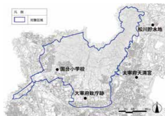
図2 人と遺跡の共存史地区

本市では太宰府らしい景観形成のため策定した、「太宰府市景観計画」(平成22年12月策定)を令和3年3月に変更し、同年7月1日(木)から施行することになりましたのでお知らせします。 景観計画の変更点 今回の計画変更では、景観の届出に係る色彩基準の内容や育成地区届出対象規模、屋外広告物などの許可申請に係る参道・小鳥居小路の色彩基準などについて、7点を変更しています。 景観計画の概要 本市では市全域を「景観計画区域」に指定し、建築物や工作物に素材・色彩などの基準があります。 また、景観上重要な2つの地区を「景観育成地区」に定め(図1・図2)、他地域とは異なる基準を設けています。 全ての地域で、建築や外壁塗り替えなどを行う際は、建築物の規模によって、工事の30日前までに市へ届出を行う必要があります。計画の詳細や届出の必要有無については、都市計画課までお問い合わせください。