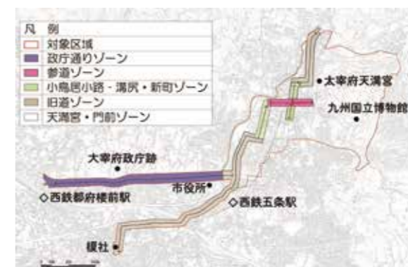
図1 天満宮と宰府宿地区