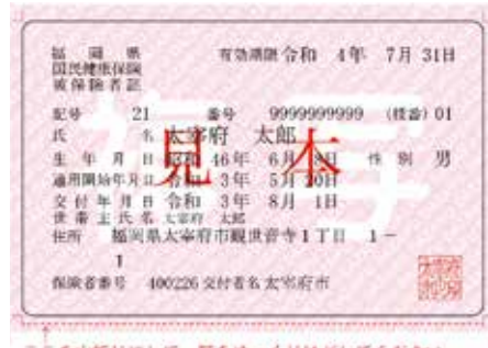
新しい保険証のイメージ

8月1日から使用する保険証を郵送します 新しい保険証(ピンク色)を6月下旬から世帯主宛てに簡易書留で郵送し、8月から使用できます。古い保険証(青色)は8月に入ってから細かく裁断して破棄してください。