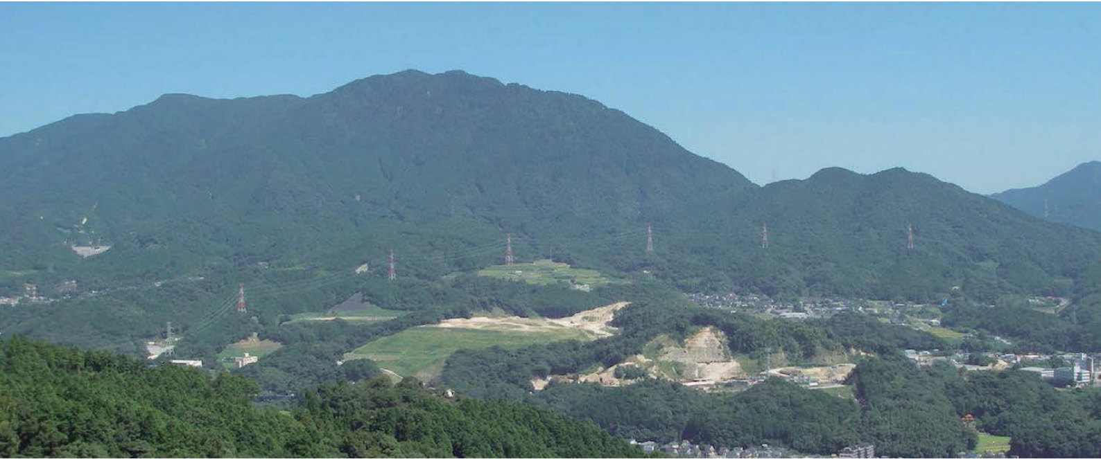
宝満山遠景（西斜面 太宰府市側）