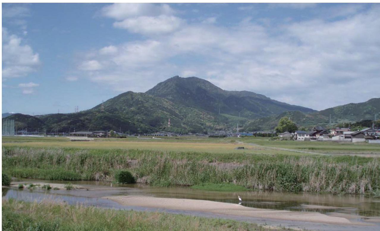
写真 1-1 宝満山遠景(筑紫野市阿志岐より)

このような状況から、遺構をはじめとした歴史的価値や史跡の基盤となる自然環境の保護を図るため、史跡の保存管理の方針、活用のあり方について、包括的に検討するために「史跡宝満山保存活用計画」を策定することとなった。