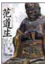
特集展示 没後350年記念 明国からやってきた奇才仏師 范道生 発行/太宰府市観光経済部観光推進課