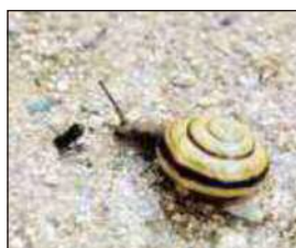
太宰府市民遺産 パネル展