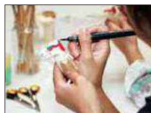
木うそ絵付け体験