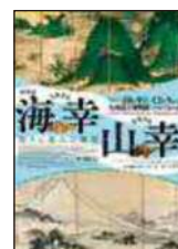
特別展海幸山幸 -折りと恵みの風景-