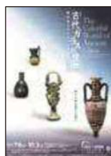
特集展示 古代ガラスの世界 - 岡山市立オリент 美術館蔵品展 -