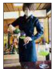
暑い夏を乗り越える！ 冷茶のすすめ