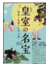
特別展 皇室の名宝 －皇室と九州をむすぶ美－