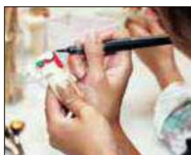
木うそ絵付け体験