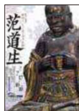
特集展示 没後350年記念 明国からやってきた奇才仏師 范道生