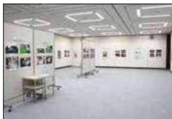
太宰府市文化ふれあい館開館 25周年記念25年のあゆみパネル展