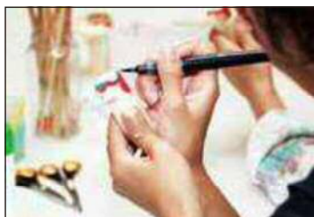
木うそ絵付け体験