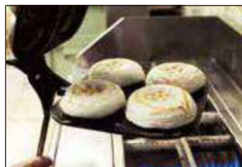
梅ヶ枝餅焼き体験