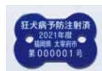
狂犬病予防注射済票 (令和3年度は青色です)