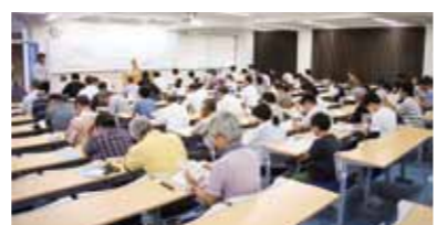
テキストを熟読し試験開始を待つ受験者ら

9月1日(土)、とびうめアリーナで、本市と筑紫野市の合同で総合防災訓練を実施しました。警固断層を震源とした震度6強の地震が発生した想定で、情報発信手順の確認や自主防災組織避難訓練、高層建物からの負傷者救出訓練、消防署・消防団による火災防ぎょ訓練などが行われました。