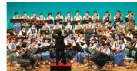
3年生合同ステージ

本年度のテーマは「繋-つながり-」です。「3年生合同ステージ」では、音楽に親しんできた仲間として、聴きにいられた観客の未来がきらめいて夢の第一歩となれるよう願いを込めた演奏を披露しました。ステージと観客がつながった、パワーあふれる演奏に会場は盛り上がりしていました。