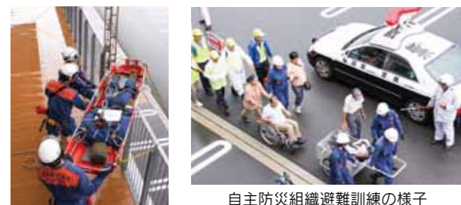
自主防災組織避難訓練の様子