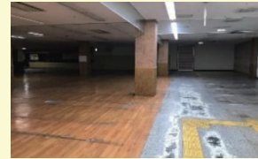
いきいき情報センター1階

A 入居事業者の公募に先立ち、公募条件を検討するため、民間事業者からの提案・意見を聴取する市場調査を、新年度早々に行う予定です。