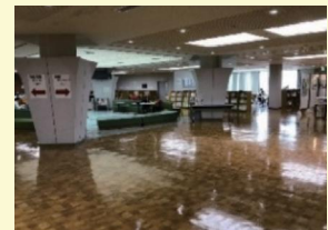
いきいき情報センター 2階

A 昨年の消費税の増税や、施設全体の収支の悪化があり、指定管理者からの要求額を勘案した結果、増額になりました。