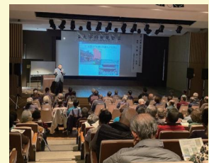
太宰府発見塾第8回講義の様子

A 参加者のリピート率が80%を超えていることや、講義の内容が専門的なものになってきたことから、「太宰府市民の方が太宰府のことを説明できるようになってほしい」という発見塾の趣旨に鑑み、一旦休止することになりました。