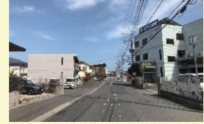
市道(水城駅・口無線)

A 移転先の建物の建築着手が遅れており、令和2年度への繰越事業になりました。なるべく早い完了を園側をお願いしていますが、支障となる建物の解体は令和3年1月から始まる計画になっています。