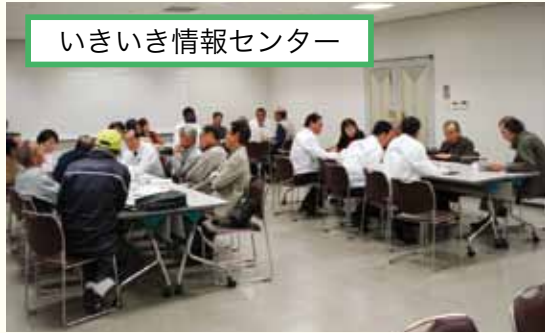
いきいき情報センター

貴重なご意見を今後の議会運営に活かすとともに、さらに開かれた議会を目指して努力してまいります。