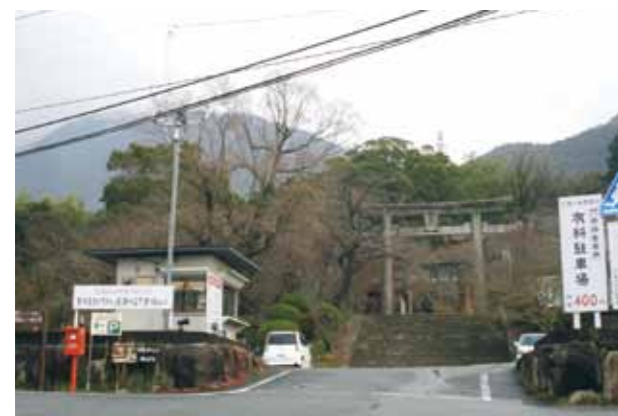
かまど神社駐車場

ただいであり、利用者から改修要望があれば、太宰府天満宮に依頼されるべきものであると考えています。 ②登山ブームによる宝満山登山客の増加、パワースポットとしてかまど神社が紹介され、多くの観光客が訪れるようになり、かまど神社では、参拝客用の駐車場の設置や警備員の配置、市としても渋滞対策としてのまほろば号の追走便や臨時便を走らせるなど、対策を講じています。 今後もイベント開催時の渋滞対策については、検討していきます。