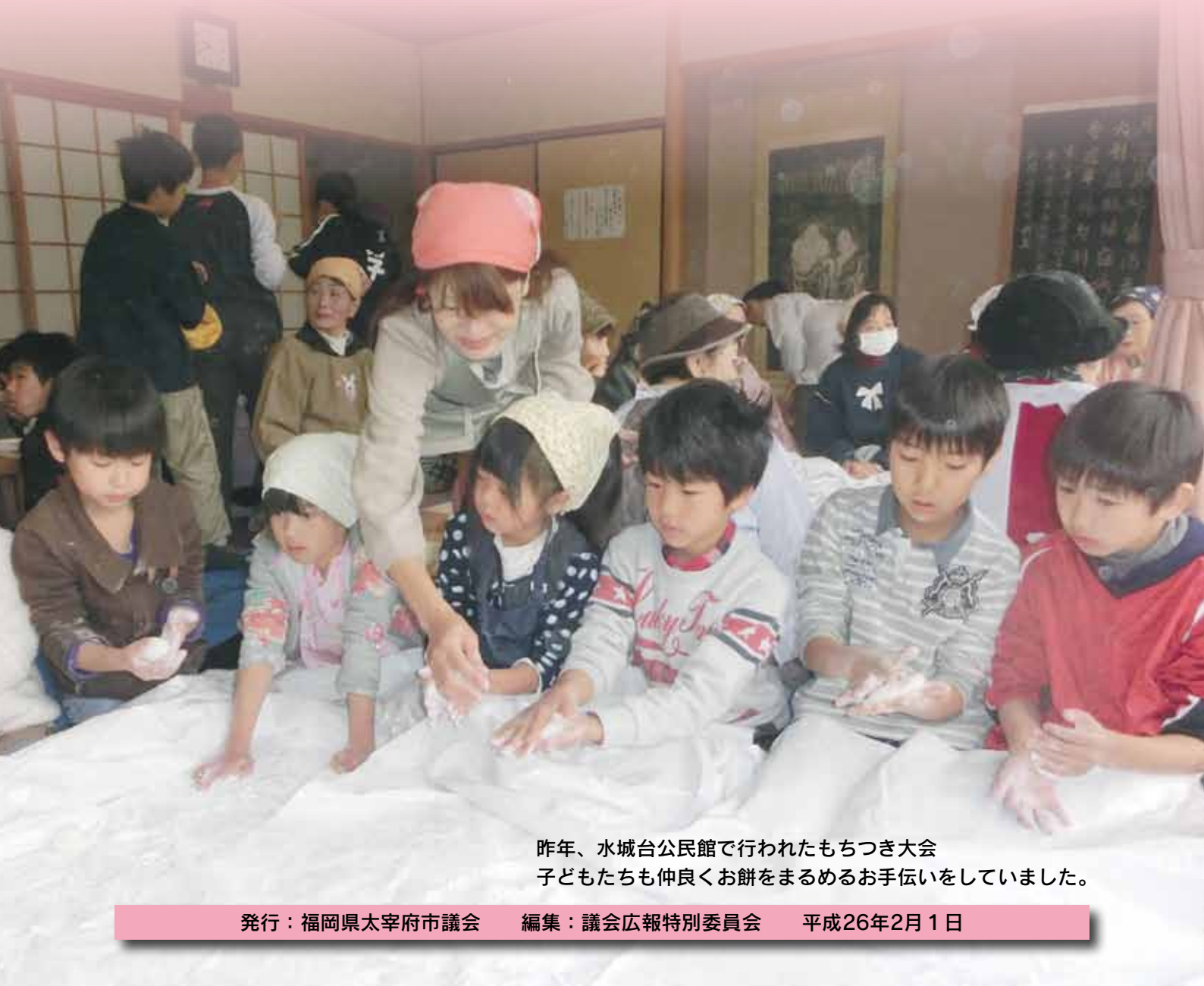
昨年、水城台公民館で行われたもちつき大会 子どもたちも仲良くお餅をまるめるお手伝いをしていました。