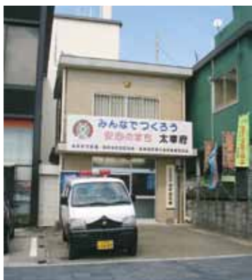
人口に見合った交番数を

A 部長 市内の犯罪件数は、平成20年461件で平成25年10月末現在で320件と年々減少しています。筑紫野署による警ら活動の強化と地域の防犯委員、見守り活動による防犯活動の成果と捉えています。また平成26年4月には、筑紫野署が分割され、春日市に新たな警察署が新設され、筑紫野警察署の管轄は、太宰府市と筑紫野市の2市となり、身近な警察署となるのでさらに連携を強化し、安全な地域づくりのため、交番設置を含む今後のあり方について、必要に応じ、要望、協議をしていかなければならないと思っております。