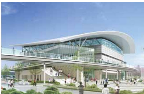
体育複合施設建設設計競技採用作品

A 市長 今回の体育館建設の建設につきましては、賛成や反対といったそれぞれの立場からの考え方がありますが、このことについては、長年にわたる市民の念願であるとともに、次世代を担う若者に夢と目標を与える競技スポーツ等への対応はもとより、少子・高齢社会に対応した子どもたちから中高年に至るまで気軽に健康づくりとスポーツに親しめる施設として私は計画しております。