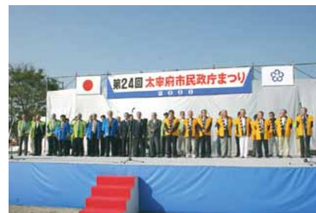
旧耶馬溪町の皆さんも参加(平成18年度太宰府市民政庁まつり)

A 部長 平成17年3月の旧耶馬溪町と中津市との合併により平成4年に締結した友好都市としての協定は自然消滅ということになっております。旧耶馬溪町との友好都市としてのえにしによりまして相互に民間交流が継続をされているところであり、しかし旧耶馬溪町との交流が中心であることから、直ちに大分県中津市との友好都市締結ということは難しいのではないかと現時点では考えております。草の根交流の裾野を市民交流で広げていければと考えているところでございます。