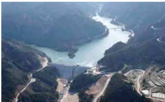
大山ダム(大分県日田市)

本市では今年度から受水量が増加し、安定した水の供給ができるようになりました。また、供給量の増加に伴い、水道水の普及促進を図るため、加入負担金の減額期間を平成28年3月31日まで、2年半延長することになりました。