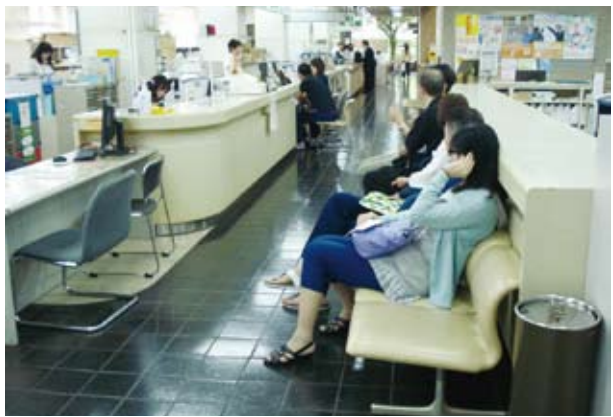
市民サービスは充実しているか

A 部長 ①本市における食物アレルギーの子どもの実態は6月1日現在、小学校7校で合計96人の児童にアレルギーがあり、うち15人がアナフィラキシーショックのおそれがある児童です。エビペンを持参して登校している児童は2名です。②保護者に使用食材のわかる献立表を事前に配付し、原因食品を除いた除去食を提供するなどの取り組みを行っている。③昨年6月、太宰府西小でエビペン研修を全教諭対象に行っている。アレルギーの情報は、養護教諭、栄養士、担任で学校全体での共有が図られておるところです。