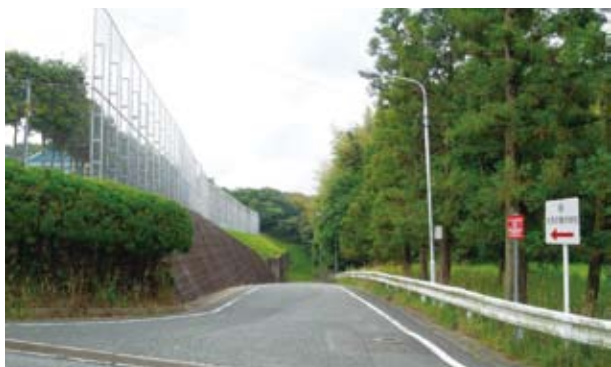
太宰府東小、中学校の通学路の安全確保を

おりますが、良好な視覚を確保するために照明灯の整備を行い安全な通学路となるよう考えております。②太宰府東小、校門前の垣根ですが、見通しが悪いという事で一部垣根の下を剪定しております。生垣が力イヅ力ですので強く刈り込むことができませぬ。今後とも生垣の剪定ができるよう関係者と協議を進めてまいります。③高雄公園北側から太宰府東小学校横までのルートについて遊歩道の勾配、歩行者の安全性などを考慮しながら検討中で、工事着工は平成26年度予定です。