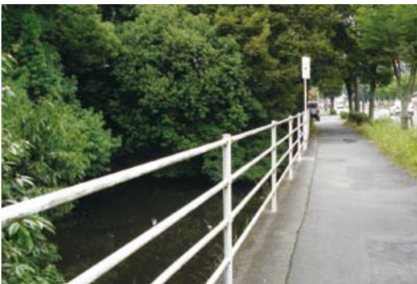
歩行者、自転車それぞれの安全確保を

分的にしか剪定の管理を行っていませんでした。歩道部については歩行者が安全に通行できるよう強めの剪定を行い、池全体を明るく見通しがきくようにしたいと考えており、まだ暗いようなら那珂県土整備事務所へ街路灯の増設を要望していきたくと考えております。 ②昭和63年に梅の花をデザインした壁画で、国土交通省、旧建設省が施工したものです。排気ガスによる汚れや経年劣化により梅の花もくすんでるのが現状です。管理者である国土交通省と協議を進めていきたくと考えています。