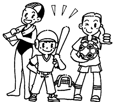
全国平均を上回るプログラム作りを

A 部長 ①太宰府市を含めまして、全国平均を下回っており体力向上は福岡県全体の課題となっております。調査結果の詳細な分析に基づき各学校の体力向上プラン作成と実践を行っていく予定です。②各学校の特色をいかした一校一取組みを推進していきます。③全国で公の学校グラウンドの芝生化の率は5%で、主に都市部が中心のようです。メリット、デメリット、管理費等を調査し、まだ課題も多く時期尚早ではないかと考えます。