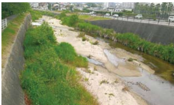
減災対策は河川管理から