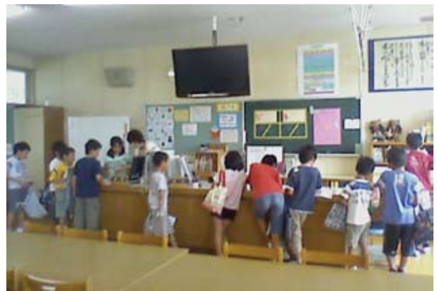
子どもがもっと本に触れる機会を