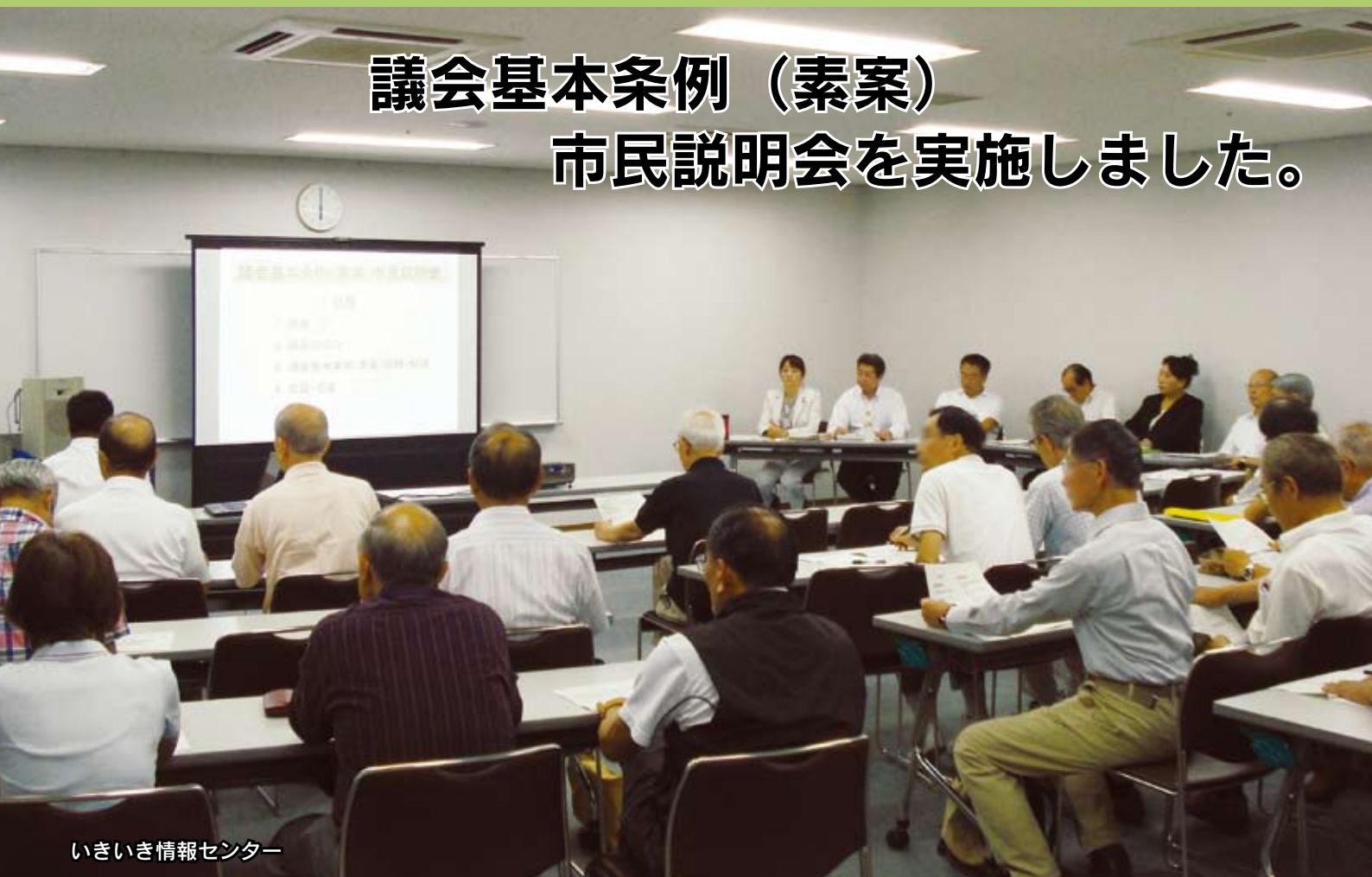
いきいき情報センター

平成25年6月15日(土)、16日(日)の2日間、市内4会場で説明会を実施しました。(最終ページに関連記事あり)