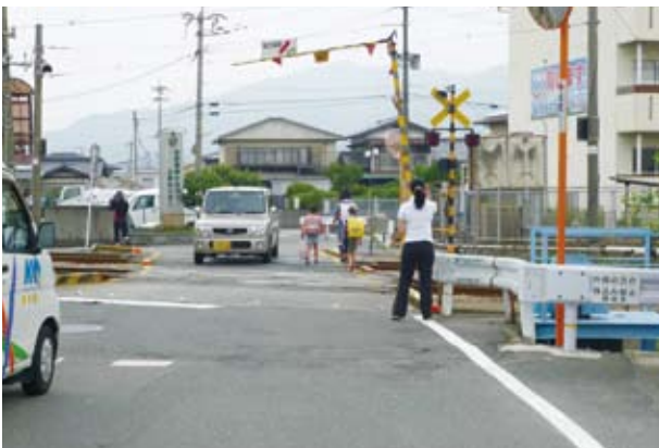
早期の踏切拡張を

A 部長 ①仮に3カ月の給与明細で判定すると、その他の収入がないのが今後の経済状況をどう予測し、追跡調査や還付請求などに及ぶおそれがあるので、現時点では困難ではないかと考えております。 ②シルバー人材センター前の踏切拡張については、社会整備事業の中の項目として挙げていますが、予算的にははつきりいつになるかは言えませんが、なるべく早い時期に着工したいと考えています。