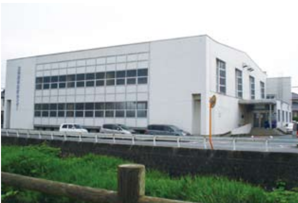
公共施設の在り方は（体育センター）

定です。年間の維持管理費は、約8600万円から4600万円、国士館大学跡地の体育館は約1000万円、体育センターは232万円、南体育館は約800万円です。高齢化社会における市民の健康づくりという観点から、新たな体育館が必要と考えています。体育センターは、中心地区、国士館大学跡地は、東部地域の屋内スポーツ施設。南体育館は地域に根差した体育施設。総合体育館は市の西部地域の体育館として、また市民大会などの中規模の大会が開催できるものと考えています。