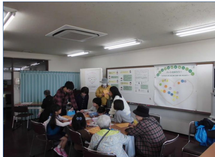
◆ルミナスフェスタでの啓発 (事業番号11 制度・慣習・慣行の見直し)