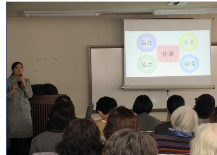
◆ルミナス主催男女共同参画セミナー (事業番号15 各種事業の開催)