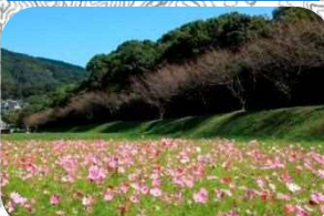
コスモスが咲いている様子