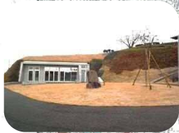
平成29年4月1日にオープンした市の便益施設。 休憩スペースや展示スペースなどがありますよ♪