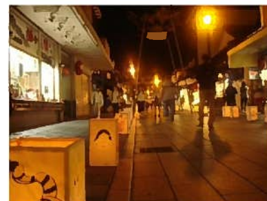
（太宰府天満宮参道）