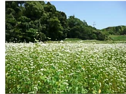
そばの花（蔵司西側）