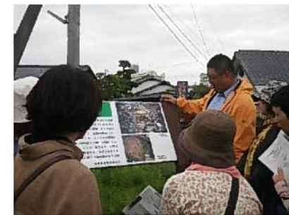
(フィールドワーク)