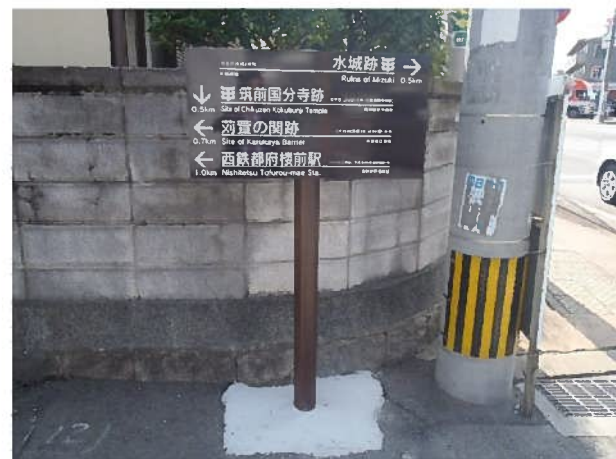
(水城跡などへの案内サイン)

太宰府市サイン整備方針に基づき、市内に現存する観光案内板の老朽化に伴う整備、並びに4カ国語対応の新規観光案内板を整備します。