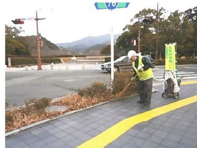
(幹線道路美化作業)