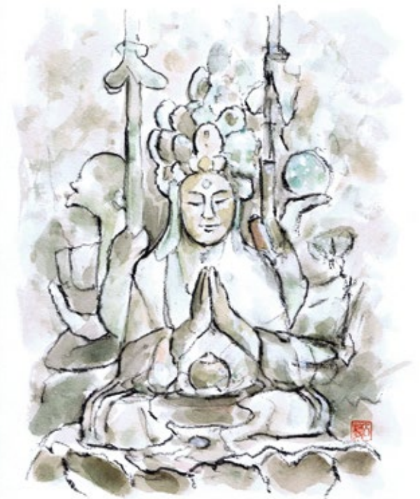
十二番札所・千手観音座像 (イラスト:広野 司)