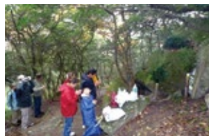
三十一番札所をお参りする親子連れ

現在でも、さい銭や花がお供えされており、三十一番札所・聖観音では、「子どもを守ってくれる仏様」として家族連れでお参りしている姿を見ることがあります。