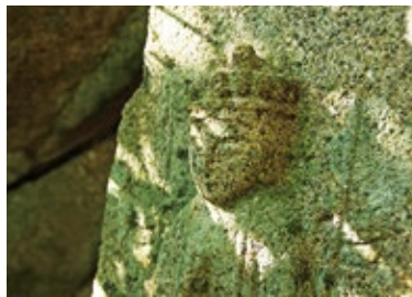
▲220年あまり四王寺山に佇み人々を見つめてきた素朴な石仏の語りかけるような表情

江戸時代後期(寛政年間)、博多で洪水や大火事、流行り病などの凶事が続くことができました。このような状況のなか、姿を自在に変えて人々を救済する観音菩薩の御利益にあやかろうと、博多の浜口町などの主だった人々が思い立ち、そこに宇美・太宰府の心ある人々も協力して、西国三十三ヶ所観音霊場にならった石仏めぐりの札所が宇美町・太宰府市・大野城市にまたがる四王寺山一円につくられたといいます。その建立は、順路を含めた山林の開拓など諸々困難を越えての大事業だったと伝えられています。