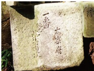
▲像を寄進した太宰府の人物名や地名が石仏の台座などに刻まれているものもある