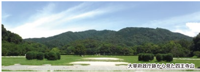
大宰府政庁跡から見た四王寺山

大宰府政庁の背後にそびえる四王寺山は、古来祈りの山、聖地であり、その歴史をつなぐかのように山の尾根線上(大野城跡の土塁上)を中心に、33の石仏から成る観音霊場が造営されています。