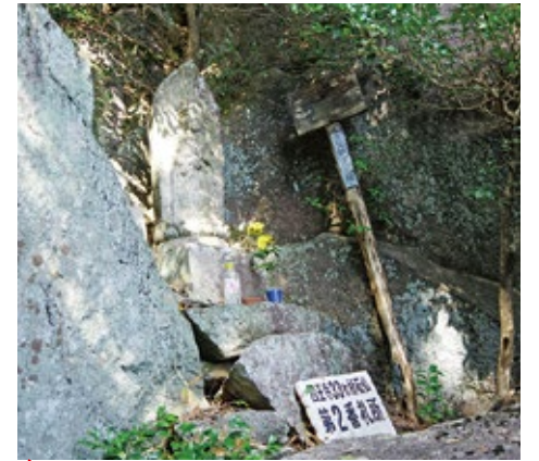
▲二番札所・十一面観音立像

岩場に守られ損傷が少なく、頭上の十一面もよく見ることができます。この場所からは眺めがよく、南には耳納連山の山影を見ることができます。