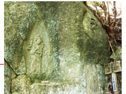
▲三番札所・千手観音立像

岩場に守られ損傷が少なく、頭上の十一面もよく見ることができます。この場所からは眺めがよく、南には耳納連山の山影を見ることができます。