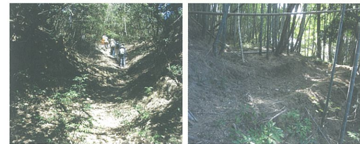
現在の太宰府町道

現在は森の中の山道となっている道も、当時この道を通っていた人たちの話を聞くと、子ども達の元気な登下校風景が蘇ってきます。この道の思い出や風景は四王寺山の日常の歴史のひとつとして、後世に伝えていきたいと考えています。