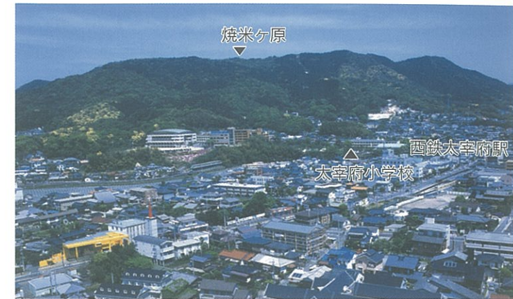
太宰府小学校と四王寺山

高低差約280m、全長約4kmの山道を通う四王寺村の子どもたちは足が丈夫で元気だったそうで、朝は40~50分程で登校していました。その姿を見た人は次のように記しています。「崇福寺横の登山口から旧道を通って上がる途中、男女の小学生数人が旧道を下って来るのに出会ったが、これらはこの部落の児童達で、太宰府小学校に通っており、毎日四軒の山坂を上下しているの、とても健康そうな子ども達であった。」