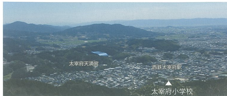
大野城跡尾花土塁からみる太宰府の街並み

昭和40年代に四王寺林道完成した後も、一部の道は昭和60年代まで使用されていました。現在でも地図に描かれているこの道は、四王寺林道が完成するまで、経済的にも文化的にも太宰府と四王寺村を深く結びつけていた大切な道でした。