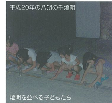
平成20年の八朔の千燈明

戦前は反り橋の左手側と心字池の周囲で献燈していたが、戦後は反り橋の終わりから楼門の間で行うようになった。