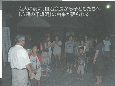
点火の前に、自治会長から子どもたちへ 「八朔の千燈明」の由来が語られる