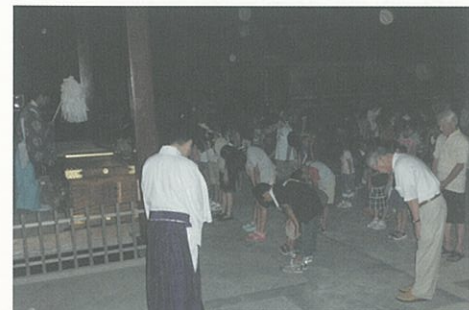
平成20年の 八朔の千燈明

五條風の会は、今回、太宰府市民遺産を提案するにあたって設立しました。発足は平成22年(2010)。五条区役員・子供会・区民が一体となって、「八朔の千燈明」を守り続けることを育成活動として掲げています。