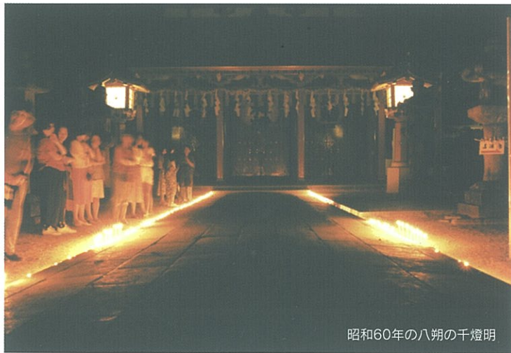
昭和60年の八朔の千燈明

江戸時代、太宰府で流行り病がおこり、五條でもたくさんの方が命を落としました。そこで、困った五條の人々が太宰府天満宮に願立をしたところ、思う人が出なくなったといいます。以来、五條の人々はそのお礼として、八朔(旧暦の8月1日)に千燈明を捧げるようになったと伝えられています。