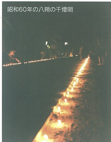
昭和60年の八朔の千燈明

その頃の五條区長のおひとりが、当時言っていたことには「昔、五條が八朔の千燈明のあっとったっちゃけん、せないかんもんな」