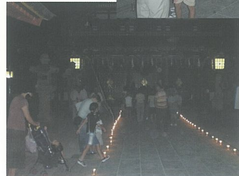
献燈中のお参りのようす