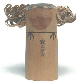
昭和40年代頃の作(占部工房)