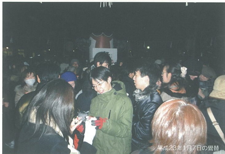
平成23年1月7日の鷺替