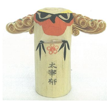
昭和50年代頃の作(岡藤工房)