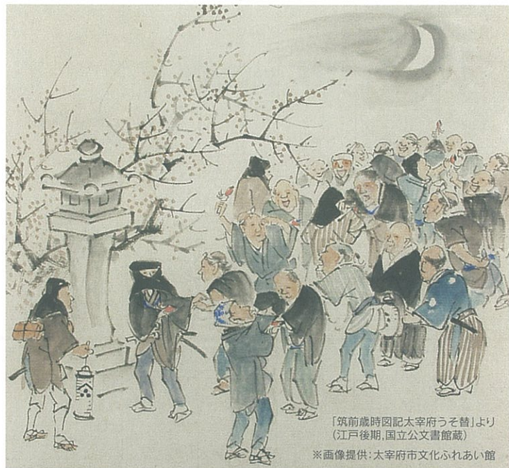
「筑前歳時図記太宰府うそ替」より (江戸後期, 国立公文書館蔵)

太宰府の木うそは、万治年間(1658 ~ 1661年)製作と伝承される絵図が『天満宮御一代記・絵本菅原実記』に記され、また太宰府天満宮の鷺替神事は、貝原益軒が貞享二年(1685)『太宰府天満宮故実』の中で「正月七日の夜はまづ酉の時ばかりにうそがへといふ事あり」と紹介しており、400年近い歴史を持っています。