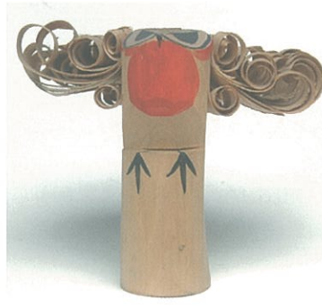
昭和30年代頃の作(高田工房)