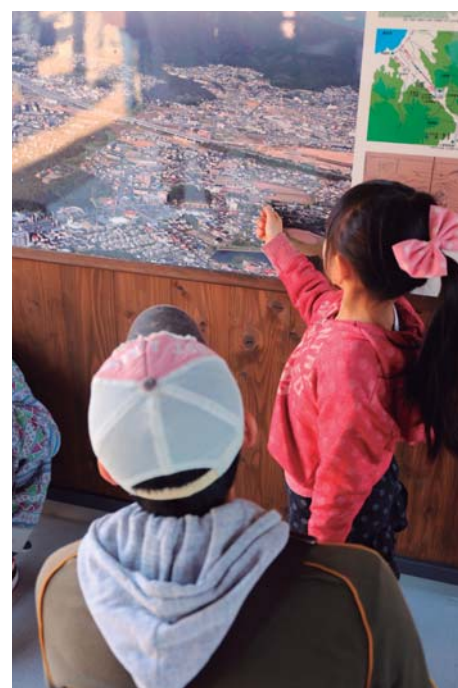
水城ゆめ広場に設置されたサイン

水城跡は、延長 1.2km にも及ぶ長大な史跡です。そのため、各エリアによって異なる性格や周辺環境との関係性を有しています。エリアごとの特性に応じた整備の方向性を定めます。