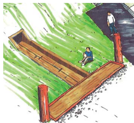
木樋の表現イメージ

大宰府都城の玄関口として、多くの人々に水城を理解してもらうために、それぞれのエリアや場所において有効な地形や土塁、濠や建物の表現に取り組みます。また、表現に際しては、それぞれの遺構がおかれている状況を鑑み、具体的な表現の検討、平面表示、さらには表現を行わないなどのレベル設定を十分に検討した上で慎重に判断します。