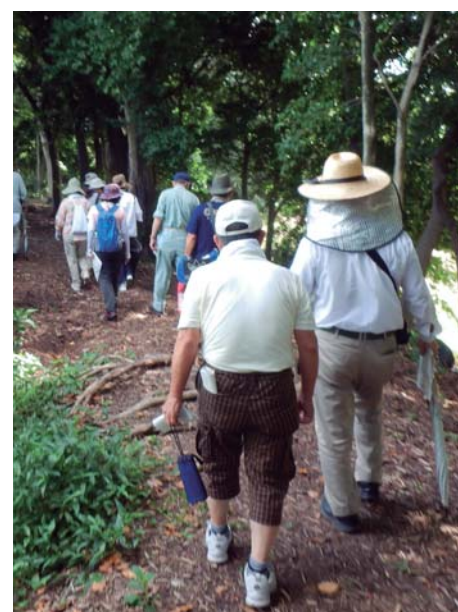
木チップ散布による土塁の保護

水城跡の確実な遺構保存を図るため、指定拡張、公有化とともに計画的な発掘調査を実施します。発掘調査などにより遺構状況を十分に確認した上で、確実な保存修理を目指し、十分な対応を図っていきます。