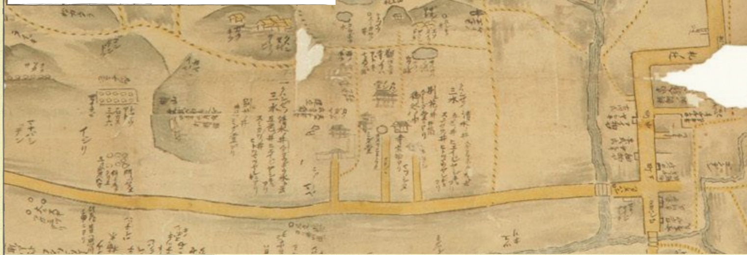
大野城太宰府旧蹟全図北 - 文化3(1806)年より一部抜粋

太宰府市歴史的風致維持向上計画で定める重点区域内で、太宰府固有の歴史的風致の維持向上を図るために、歴史的風致を形成している国指定文化財以外の歴史的建造物で、その価値を認められるものについて歴史的風致形成建造物に指定することとしています。