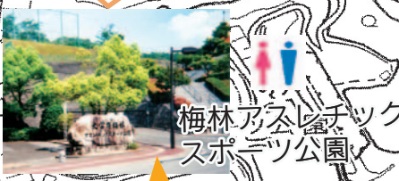
梅林アスレチックスポーツ公園