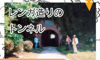
レンガ造りのトンネル