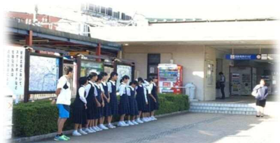
五条駅前での『朝の全力挨拶運動』