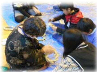
地域人材による体験学習