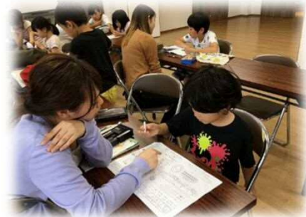
寺子屋学習ーボランティアの大学生と一緒に学習