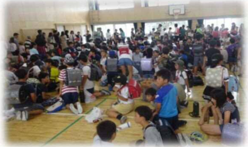
安全・安心応援団による「引き渡し訓練」