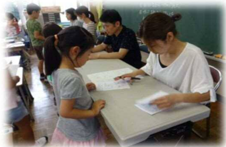
学び合い応援団が運営・募集する「丸付け先生」