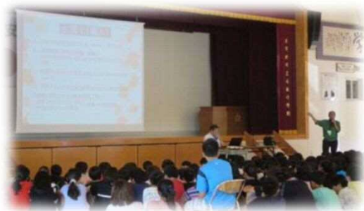
自治会主催「みずき安全フェスタ」