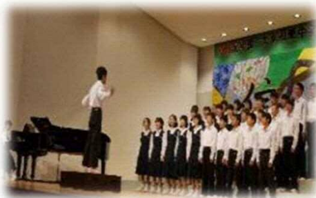
みんなで創る合唱コンクール(文化発表会)