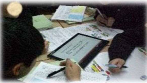
ふかめ・ひろげ合う学びの協同活動