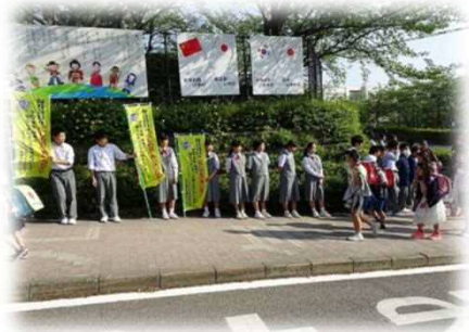
「にしの日」あいさつ運動