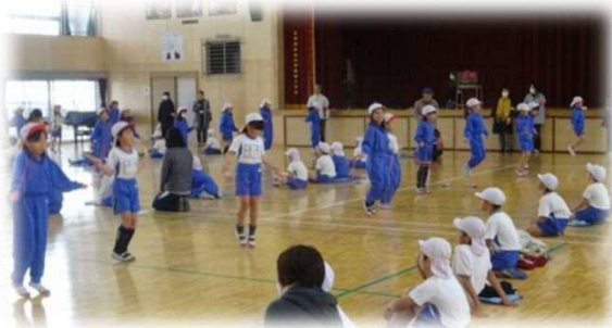
鍛え合い応援団による「なわとびチャレンジ」