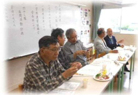
南っ子力かし隊総会