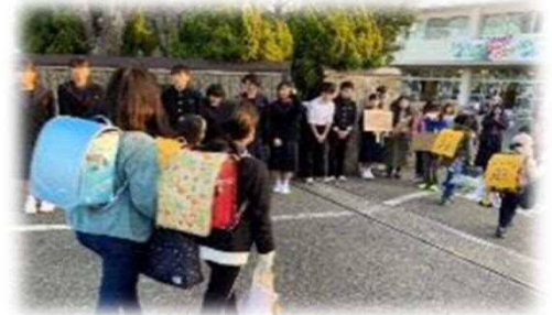
小中連携で行うあいさつ運動