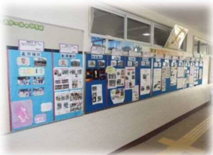
児童昇降口の自治会紹介コーナー