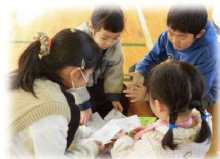
東っ子の宝「思いやり」:子ども同士の思いやりの行動で