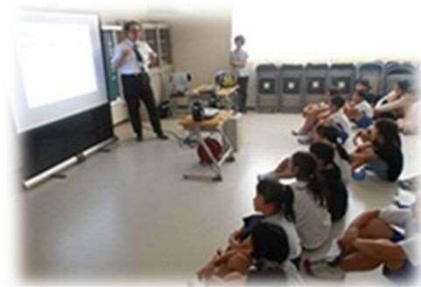
PTA主催ふるさと学習「大宰府歴史講座」