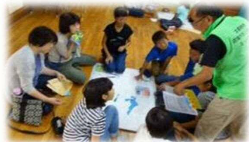
地域・保護者・学校が一緒に行う合同防災教室