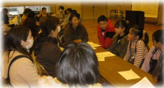
コミュニティ・スクール全体会