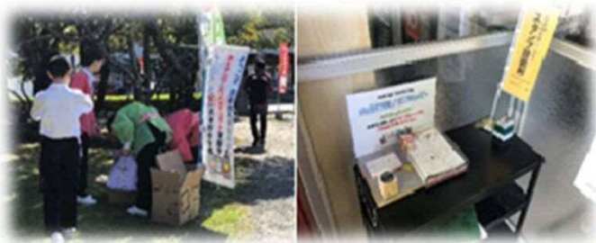
「令和」に関わる地域活動