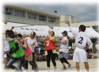
地域・学校合同運動会