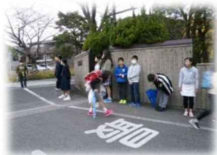
東っ子の宝「あいさつ」:小中合同の挨拶運動