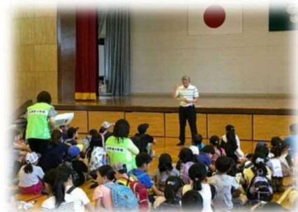
家庭・地域との引き渡し訓練