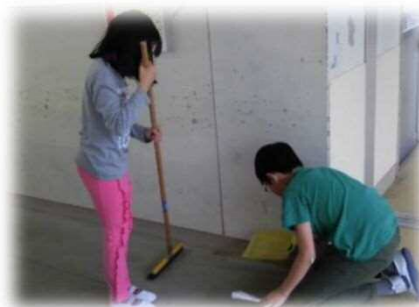
東っ子の宝「そうじ」:黙想・黙々掃除