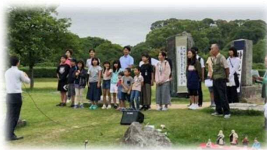
地域行事「時の記念日」で校歌を歌う地域の方々子どもたち