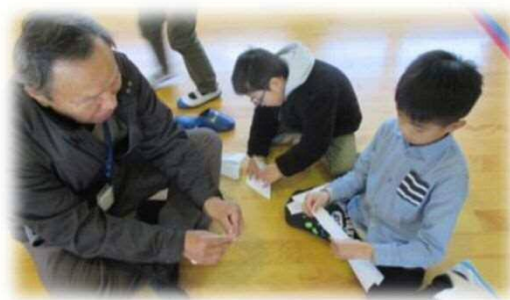
地域の方に昔遊びを教えてもらう1年生