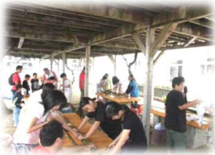
応援隊主催デイ・キャンプ