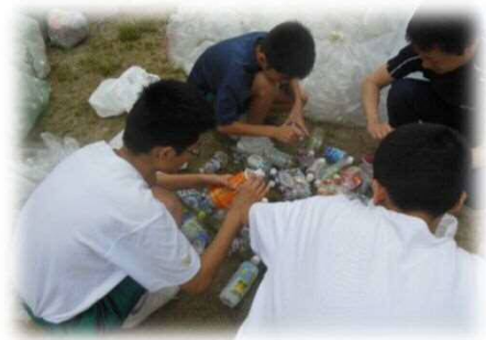
地域での資源回収活動