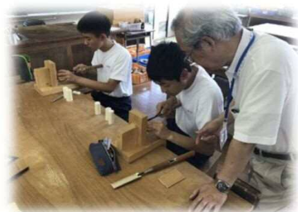
文化理解科 木うそコース