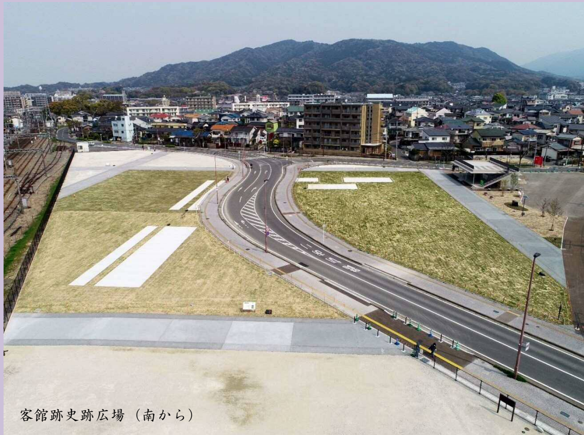
客館跡史跡広場（南から）