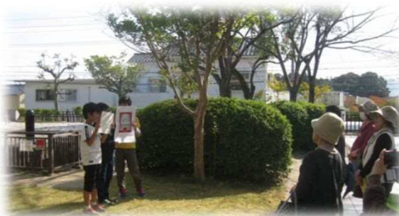
6年生の史跡解説員