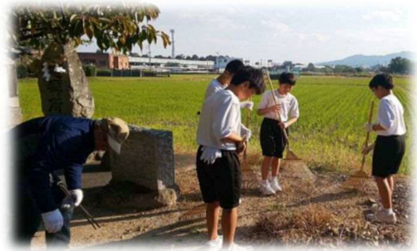
地域貢献活動(地域清掃)の実施