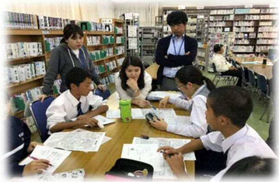
地区別集会の実施