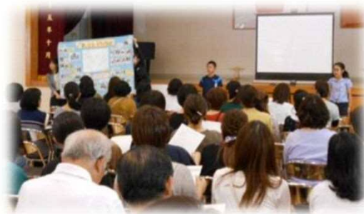
地区懇談会でのふるさと委員会からの発信