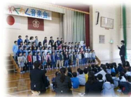
東っ子の宝「歌声」:保護者や地域の方の前で歌声を披露