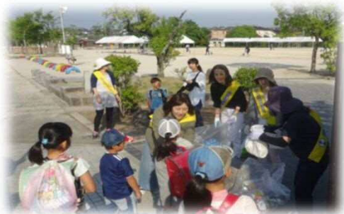
認め合い応援団によるあいさつデー「にしの日」