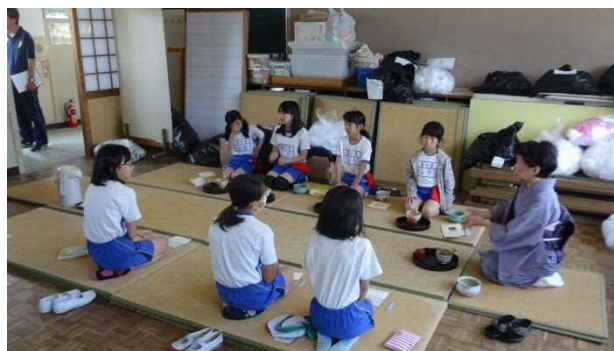
地域のG Tに教えていただくクラブ活動