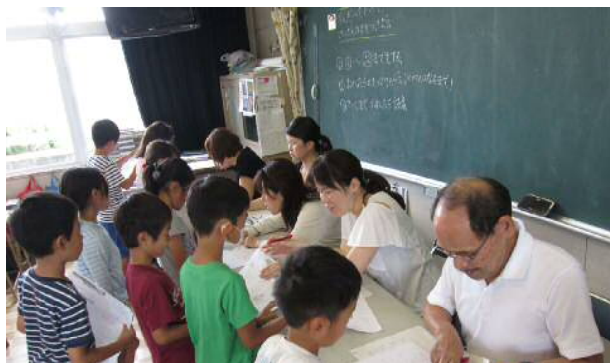
学び合い応援団が運営・募集する「丸付け先生」