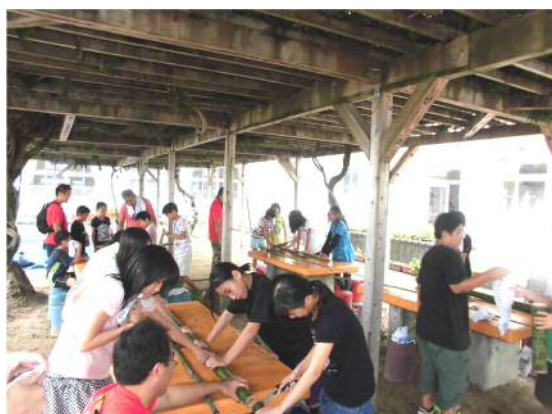
応援隊主催デイ・キャンプ