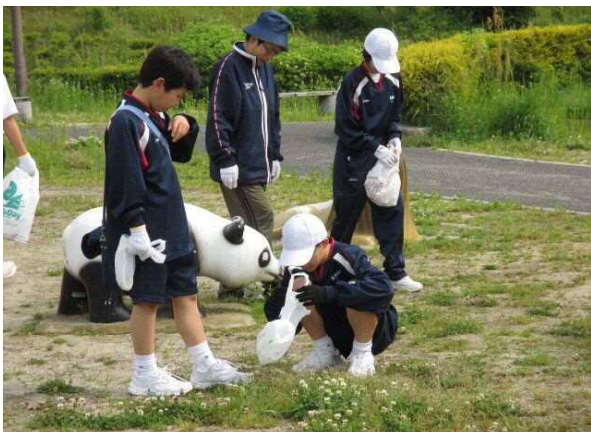
【地域清掃ボランティア】