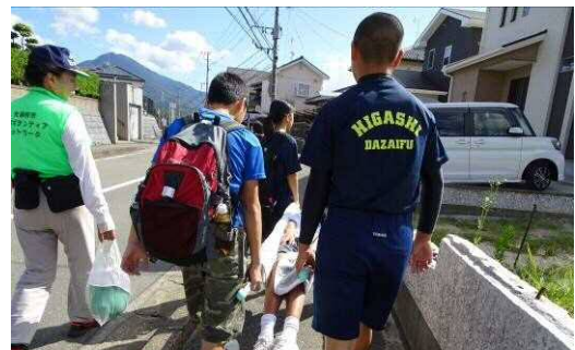
学校運営協議会本部が核となって運営する防災合同教室