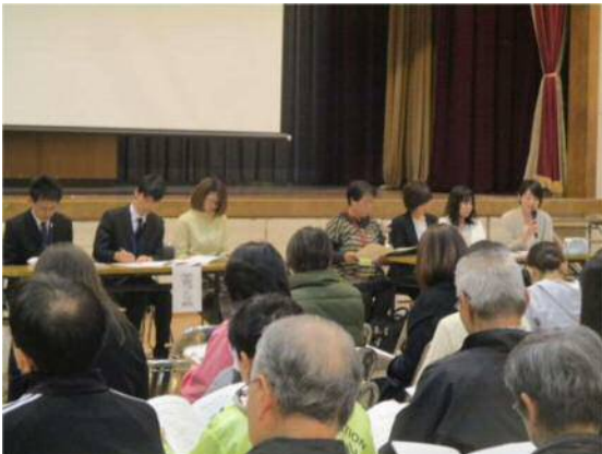
コミュニティ・スクール全体会