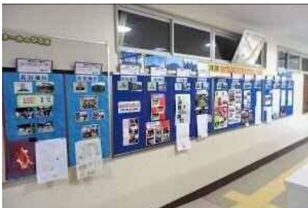
児童昇降口の自治会紹介コーナー