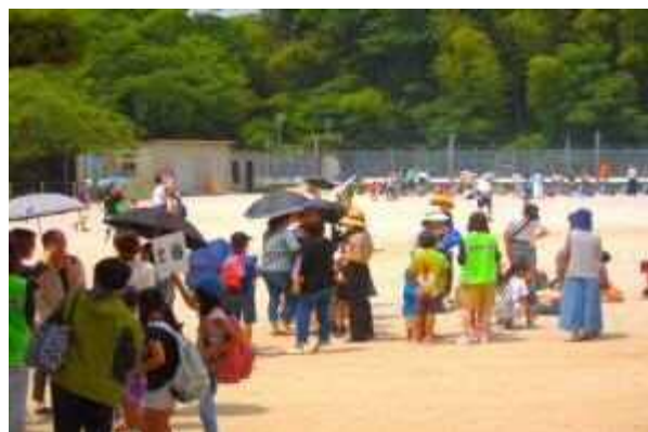
家庭・地域との引き渡し訓練