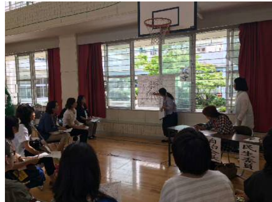
地区懇談会での「危険箇所マップ」確認