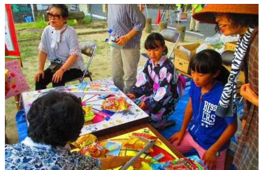
地域貢献活動「まほろば活動」で夏祭りのお手伝い