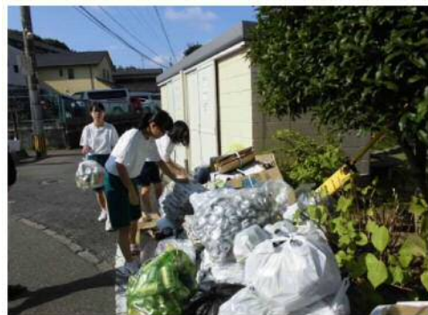
◆ 地域での資源回収活動 (五条地区での資源回収)