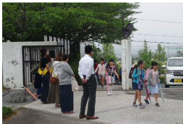
正門での地域あいさつデー「にしの日」