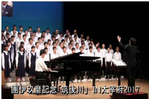
團伊玖磨記念「筑後川」IN太宰府2017