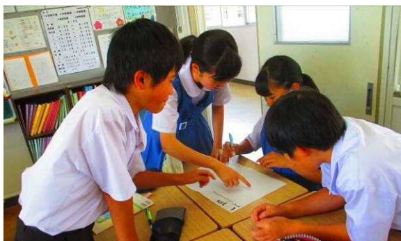
穏やかな人間関係育むリレーション活動で「学びの協働活動」の効果を高める