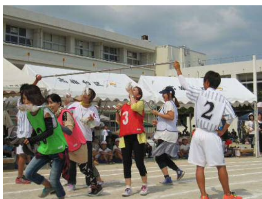
地域・学校合同運動会