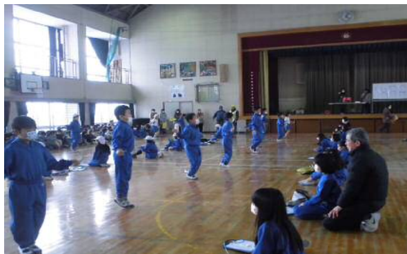
鍛え合い応援団による「なわとびチャレンジ」