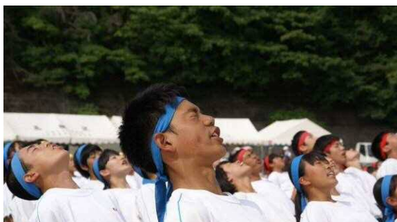
生徒のだれもが精一杯の姿を見せる感動の体育会