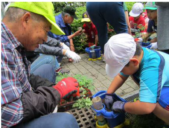
2年生「野菜づくり」GTの地域の方々