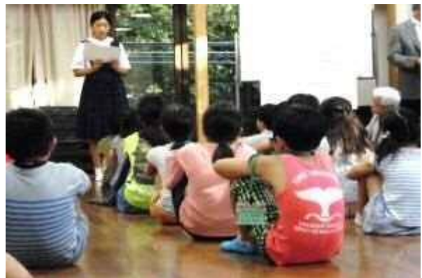
通学合宿(中学生による体験発表)