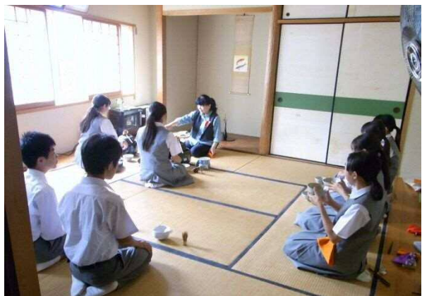
【文化理解科 茶道コース】