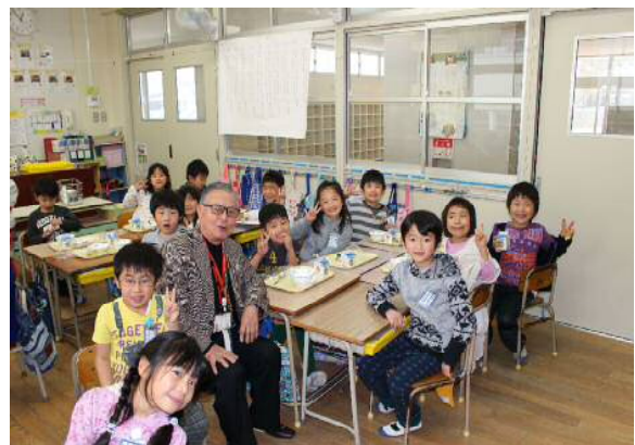
ボランティアの方々を招いた「招待給食」