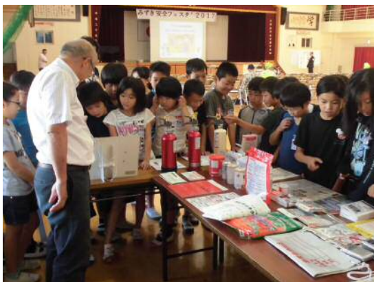
自治会主催 「みずき安全フェスタ」