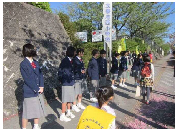
【「にしの日」あいさつ運動】