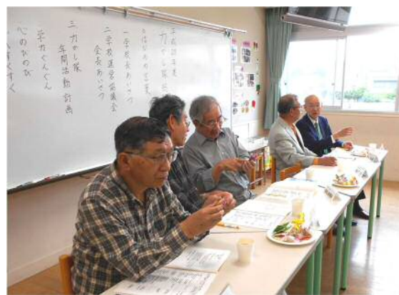
南っ子力かし隊総会