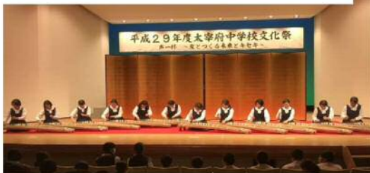
◆ 團伊玖磨『筑後川』合唱