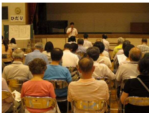
コミュニティ・スクール全体会