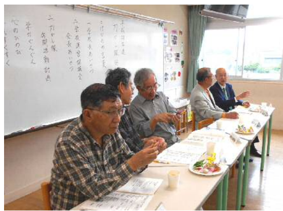
南っ子力かし隊総会