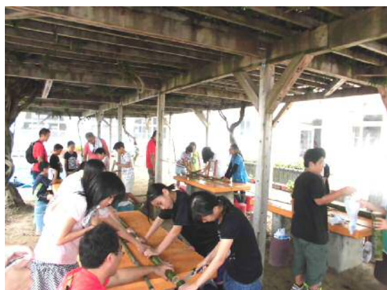
応援隊主催デイ・キャンプ