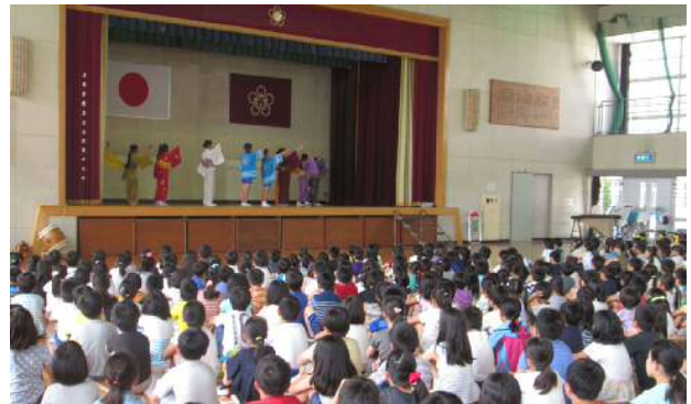
韓国の百済初等学校との姉妹校交流