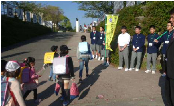
西中校区の地域あいさつ運動「にしの日」