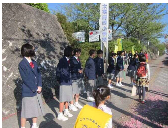
【「にしの日」あいさつ運動】