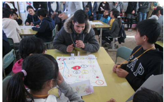
保護者や地域の方が参観するワールド交流会