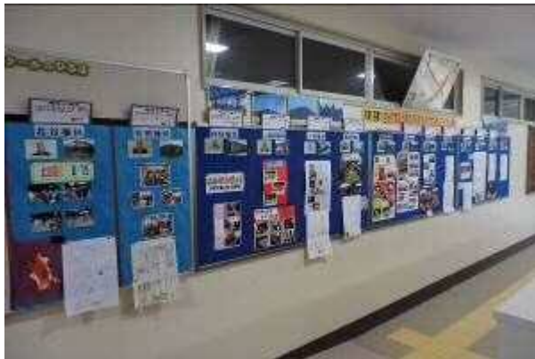
児童昇降口の自治会紹介コーナー

「郷土太宰府が好きで、郷土の発展に貢献しようとする児童生徒の育成」を太宰府中学校ブロックの共育目標とし、地域・家庭・学校がそれぞれの役割を果たしながら、コミュニティ・スクール担当教員と地域コーディネーターの連絡・調整のもと、子ども達のよりよい成長を図ります。