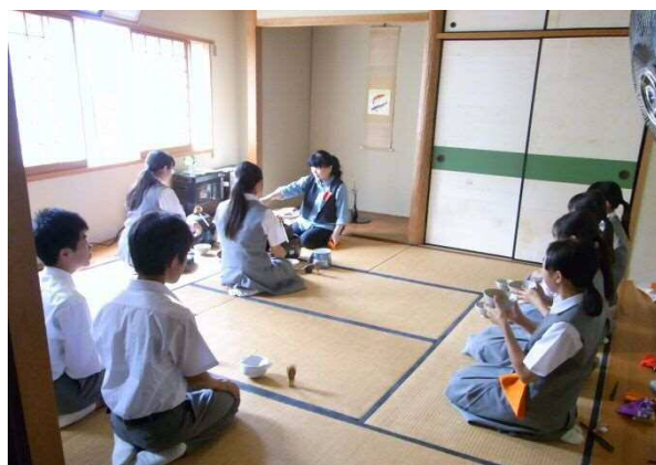
【文化理解科 茶道コース】