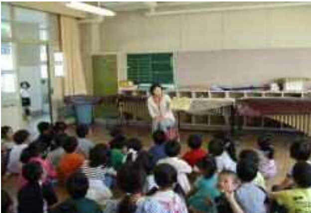
本の楽しさ ～読み聞かせボランティア～