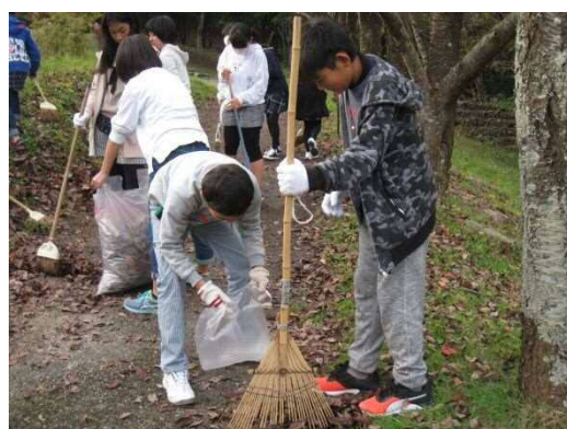
地域に貢献クリーン作戦