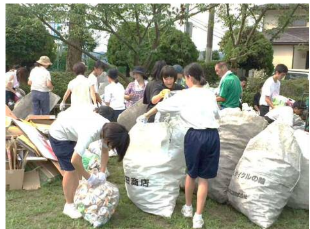
夏休みの資源回収を頑張りました