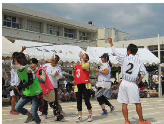
地域・学校合同運動会