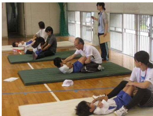
三者が連携した体カテスト