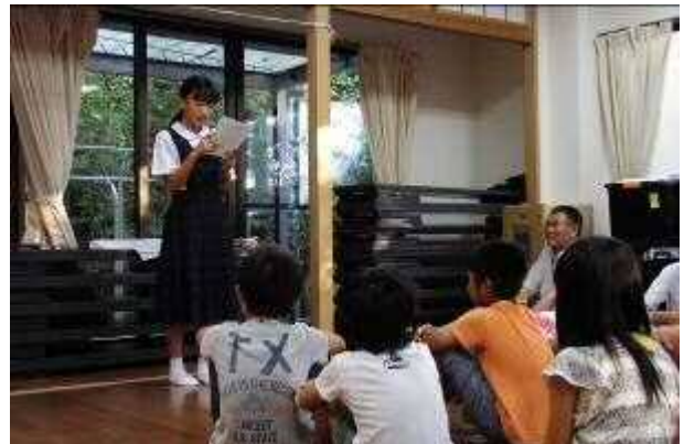
通学合宿(中学生による体験発表)