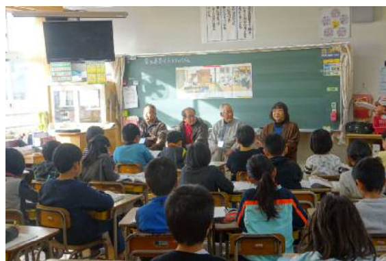
地域の方を招いた学習の様子