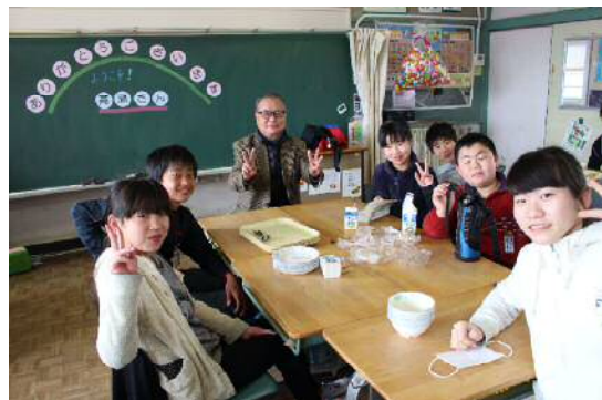
ボランティアの方を招いた招待給食