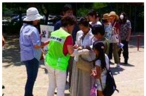
家庭・地域との引き渡し訓練