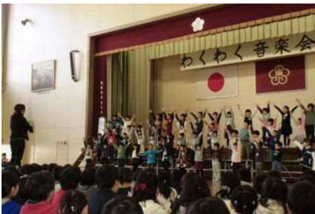
～ わくわく音楽会 ～