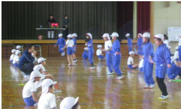
鍛え合い応援団による「なわとびチャレンジ」