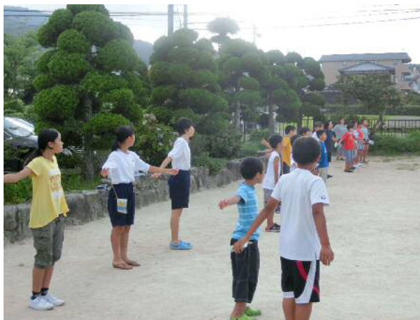
ラジオ体操の手本をしています