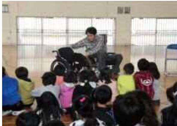
車イスについて学ぶ