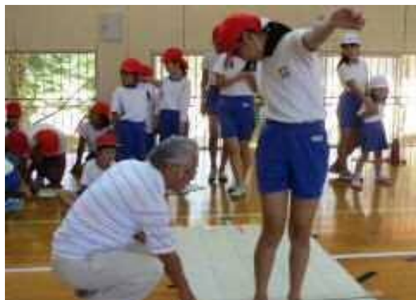
新体力テスト ～地域の方と共に～