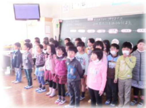
サイレントデー・3Q授業