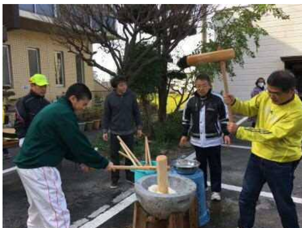
地域の餅つきに参加しました