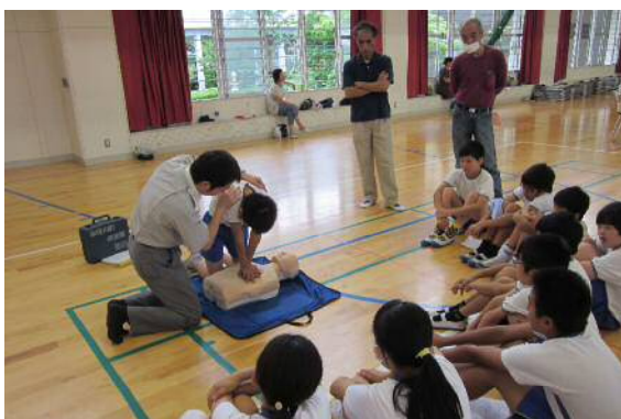
自治会主催の安全フェスタの様子