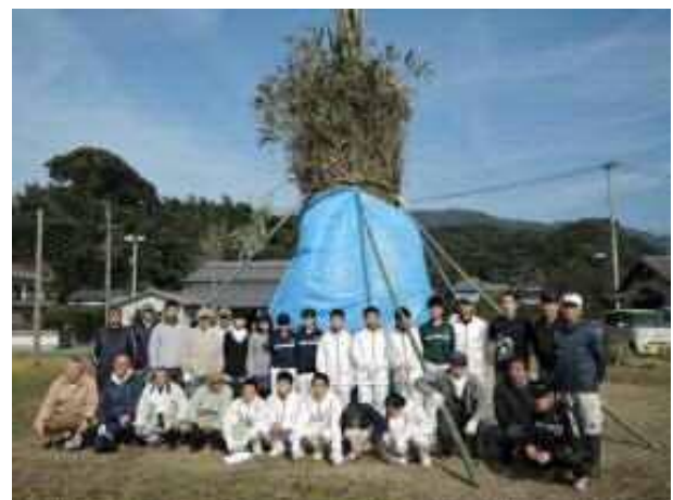
伝統行事「ほうげんきょう」のお手伝い