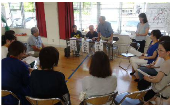
地区懇談会の様子