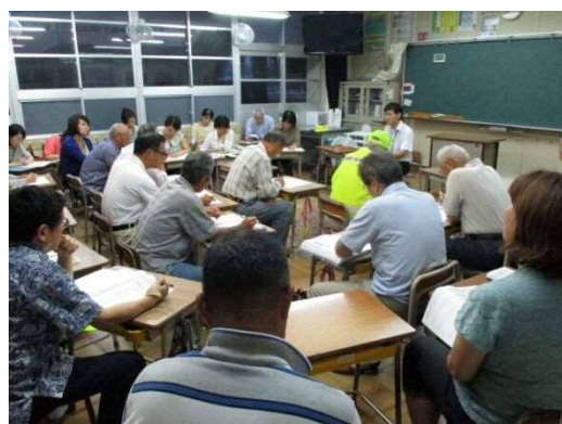
コミュニティ・スクール各部会