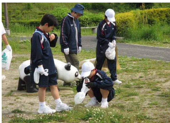
【地域清掃ボランティア】