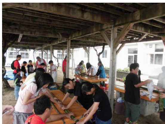
応援隊主催デイ・キャンプ