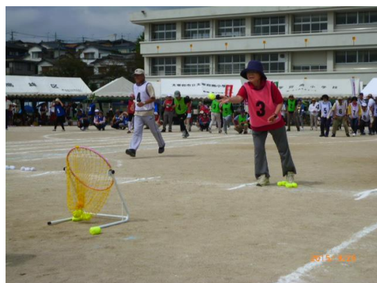
地域・学校合同運動会