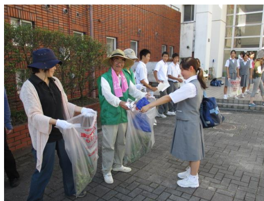
【毎月のピックアップ登校】