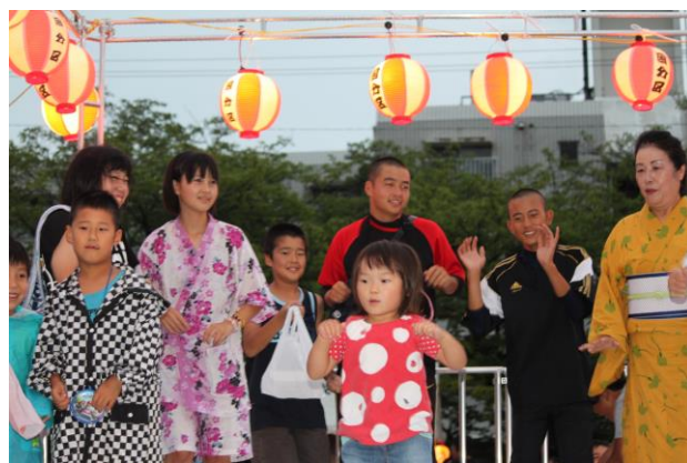
地区夏祭りへの参加