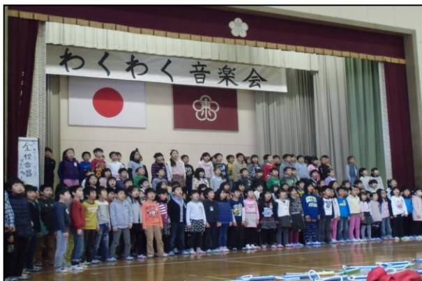
伸びやかな歌声を響かせて