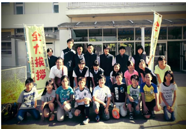
小中合同「あいさつ運動」