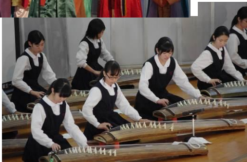
◆地域の人材を生かした「飛梅タイム」 (総合的な学習の時間) 文化祭での万葉歌披露と箏演奏