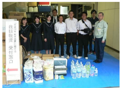
◆地域での生徒会による自主活動 (熊本地震への救援活動)