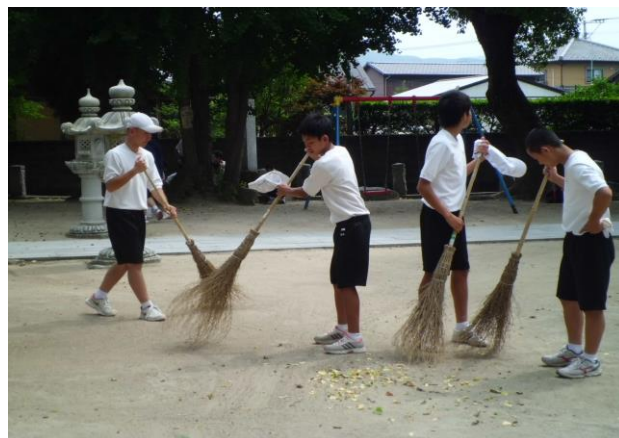
地域貢献活動として地域清掃