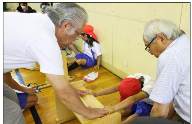
新体力テスト ～地域の方と共に～