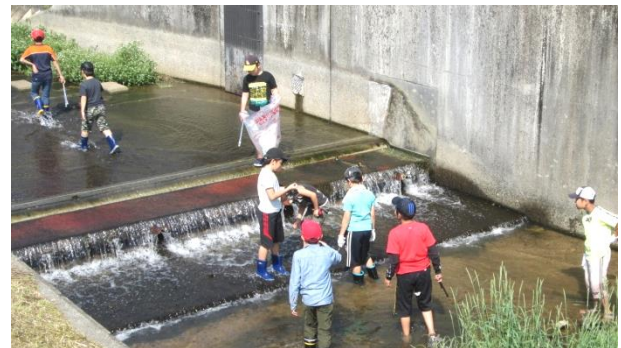
地域住民・保護者と一緒におおさの川清掃