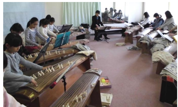
琴クラブのGTさんとの練習風景