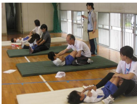
三者が連携した体力テスト