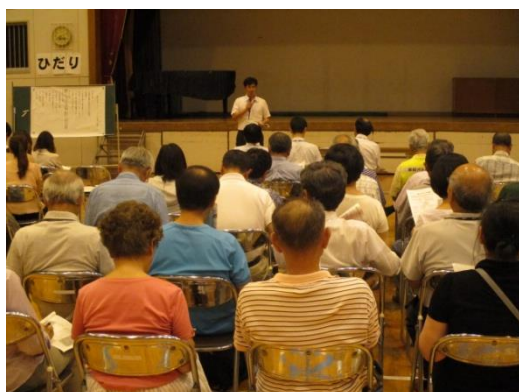
コミュニティ・スクール全体会