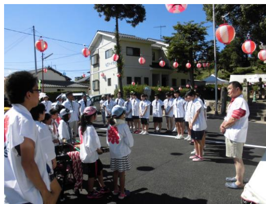
【夏祭りのボランティア】