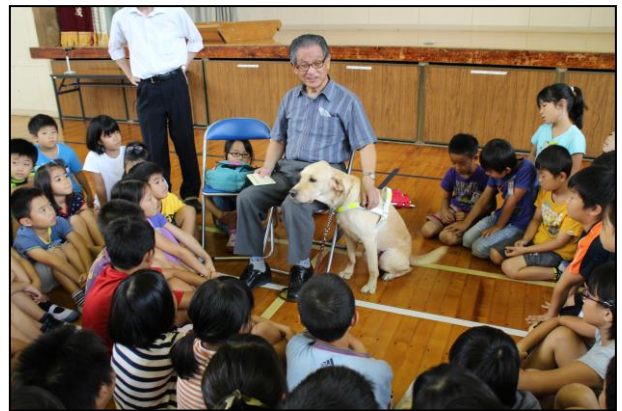
盲導犬について学ぶ