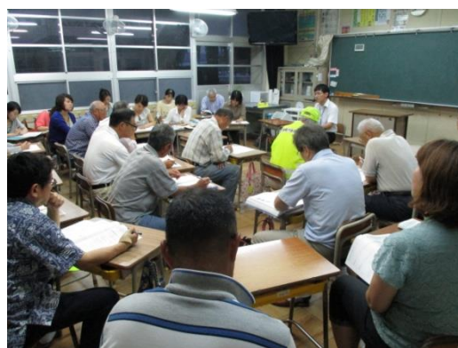
コミュニティ・スクール各部会