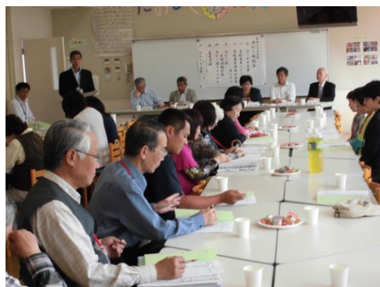
南っ子力かし隊総会