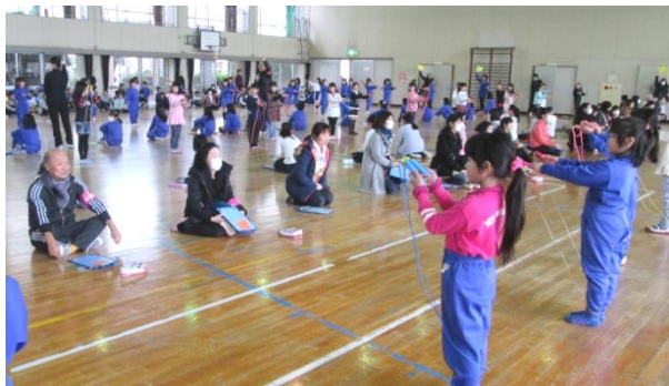
鍛え合い応援団による「なわとびバトル」