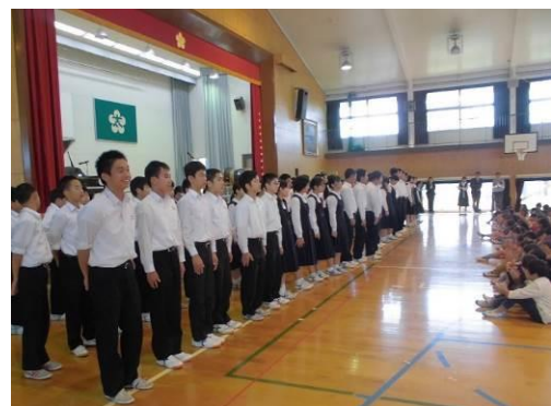
◆太宰府小・中連携による太宰府小学校での中学生合唱披露