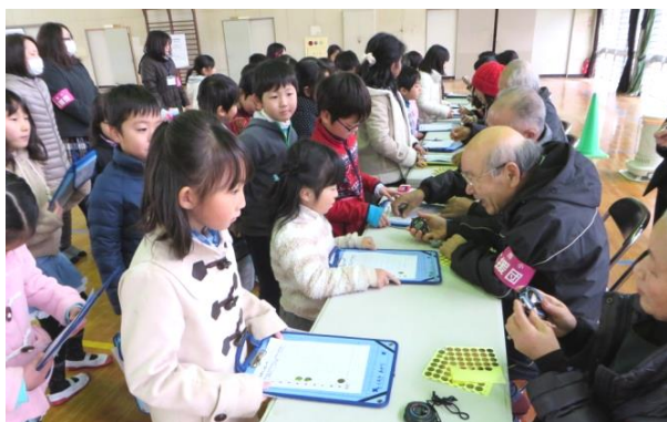
学び合い応援団の2年生のかけ算九九大会