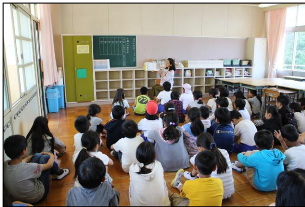
本の楽しさを ～読み聞かせボランティア～