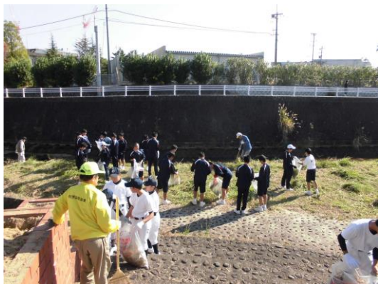
【27年度秋の「おおさの川清掃」】

・職場体験学習・留学生との交流・文化理解科・おおさの川清掃・地域行事等の手伝い等