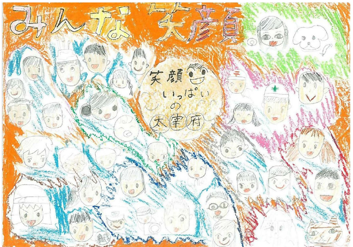
水城小学校4年 八尋 ひなた（やひろ ひなた）様 タイトル：笑顔いっぱいの太宰府