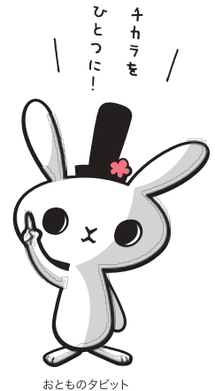
おとものタビット

共通する想いは「今より住みよい太宰府の未来」。そのために日々チカラを合わせ、想いを繋いでいます。