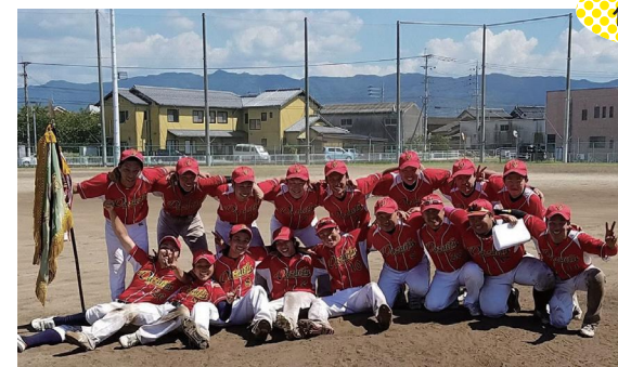
最近の野球部の実績

太宰府市は仕事だけでなく、クラブ活動も盛んに行われています。終業後や土日に野球の練習や試合を行うため、リフレッシュでき生活の一部になっています。野球部員は約30人おり年齢層も幅広いので、どの部署の人でも気軽に相談でき、手助けしてくれるので仕事も充実したものとなっています。野球部のほかにサッカー部やテニス部などもあるので自分に合ったクラブ活動を見つけることができます。ぜひ!太宰府市で一緒に野球(仕事)をし、健康で活気溢れる職場を共に作っていきましょう!