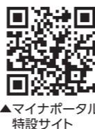
▲マイナポータル 特設サイト

※マイナ保険証として利用するには、マイナポータル、セブン銀行ATM、病院・薬局などで 事前の登録が必要です。