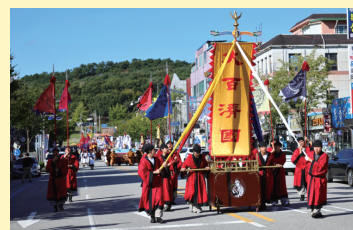
百済文化祭の様子