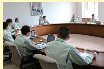
熱中症特別警戒アラート危機管理関係者会議の様子

※熱中症特別警戒アラート：過去に例のない危険な暑さとなり、熱中症救急搬送者数の大量発生を招き、医療の提供に支障が生じるような、人の健康に係る重大な被害が生じる恐れがある場合に、前日の午後2時に発表されるもの。