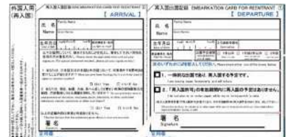
「再入国入国記録・再入国出国記録」カード

短い期間だけ日本を出て、もう一度同じ目的で日本に入るときは、「再入国入国記録・再入国出国記録」カードを書いて出してください。日本を出るときに空港でもらって書きます。