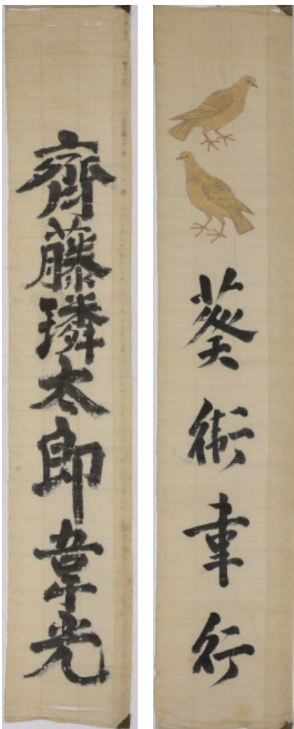
202.7 × 35.4cm

拜山とともに海をわたり、日中の文人がコラボした、貴重な還暦祝いの逸品です。(井形栄子)