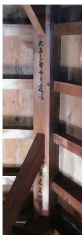
「大正三年七月建設」と書かれた拝山の書