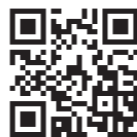
▲コンビニ交付公式サイト

コンビニ交付のメリット 土日・祝日、夜間・早朝を問わず、自宅の近くや外出先でも取得できます。