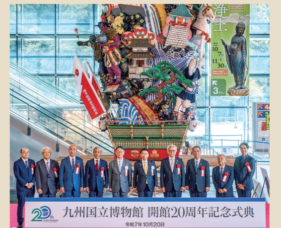
開館20周年記念式典

新年度も、皆様の知的好奇心を刺激する魅力的な展示を順次開催いたします。特集展示では、最新の知見を盛り込んだ「科学の眼でみる遼の金工品」(5/26~7/20)や、九州各地の渡来仏の歴史を展観する「九州渡来仏」(7/7~8/30)を開催。特別展では、日本美術の名品が揃う「若冲、琳派、京の美術—きらめきの細見コレクション—」(4/21~6/14)、夏には4万年前の世界へ誘う「氷河期展~人類が見た4万年前の世界~」(7/18~9/27)をお届けします。時空を超える旅を通して新たな世界を発見できる九博を、今後ともどうぞよろしく願い申し上げます。