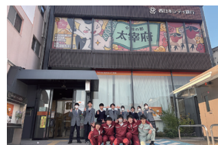
おもてなしアート第5弾

3月12日(木)、西日本シティ銀行太宰府支店2階に設置している「おもてなしアート」がリニューアルしました。筑紫台高校と西日本シティ銀行、本市が「太宰府を盛り上げよう」と取り組む連携事業の第5弾で、同校の美術部が制作。令和の都だざいふ応援大使「おとものタビット」などが描かれた躍動感あるデザインで、太宰府駅に降り立つ観光客を迎えます。地元高校生によるおもてなしの思いあふれる力作です。お立ち寄りの際はぜひご覧ください。