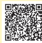
講演会申込フォーム