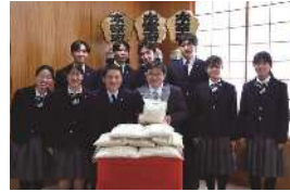
総合探究外部連携探究子ども食堂チームの皆さん

総合探究(外部連携探究)の一環として、文化祭における収益をお米に代えて、物価高騰の影響で食材の確保に苦慮している市内の子ども食堂に協力したいという生徒たちの強い思いにより、実現しました。