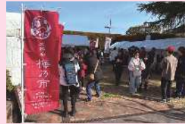
太宰府梅乃市の様子

2月23日(月)梅マルシェ「太宰府梅乃市」を行いました。会場には市内外から梅の花が香る季節にピッタリの「梅」商品が集合しました。2,000名を超える方が訪れ、来場者からは「梅ヶ枝餅以外に太宰府にこんなにとくさんの梅商品があるとは知らなかった」「また来たい」との声がありました。今後も「太宰府＝梅のまち」の認知度向上につながる取組を続けていきます。