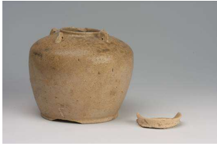
左：灰釉陶器 短頸四耳壺 右：蓋（土師器高台部転用）