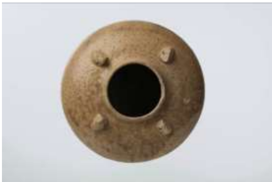
四耳の取り付け状態 （上から）