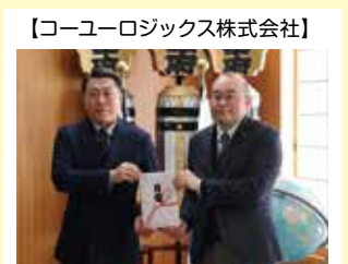
【コーユーロジックス株式会社】