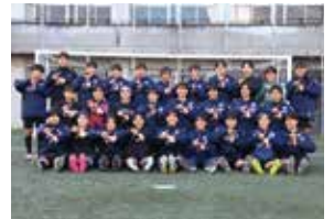
筑陽学園女子サッカー部の皆さん

なお、12月29日(月)に行われた全国大会1回戦で専修大学北上高等学校(岩手県代表)と対戦し、健闘しましたが、0-4で敗退となりました。