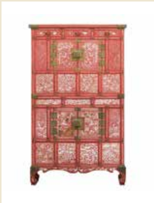
朱漆十長生文螺鈿筆箱 (徳恵翁主婚礼調度品) 20世紀前半 九州国立博物館

ラストプリンセス徳恵翁主の宝は日本で初めての公開となります。九博が所蔵する韓国文化遺産の至宝を見て、日韓の未来のあゆみに思いを馳せてください。