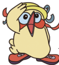
まほろば号 キャラクター まほちゃん

バス事業の現状は、年々厳しさを増しています。全国的にも利用者数がコロナ禍前の水準に回復していないことや、燃料費をはじめとする物価高騰、乗務員の不足などが背景にあります。これからも引き続き、皆さんの積極的な利用をお願いします。