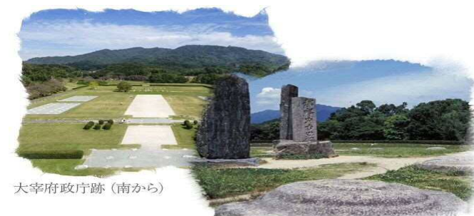
大宰府政庁跡（南から）