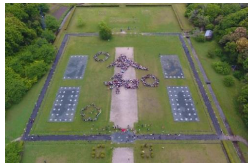
(大宰府政庁跡 ※5 )

太宰府市、NPO 法人バリアフリーネットワーク会議、全日本空輸株式会社(本社:東京都港区)、ANA あきんど株式会社(本社:東京都中央区)は、ユニバーサルデザインに基づく総合的な移動サービス「Universal MaaS」の共同プロジェクトを開始します。