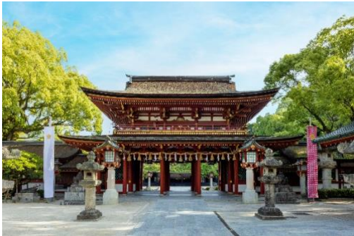
(太宰府天満宮 ※4 )