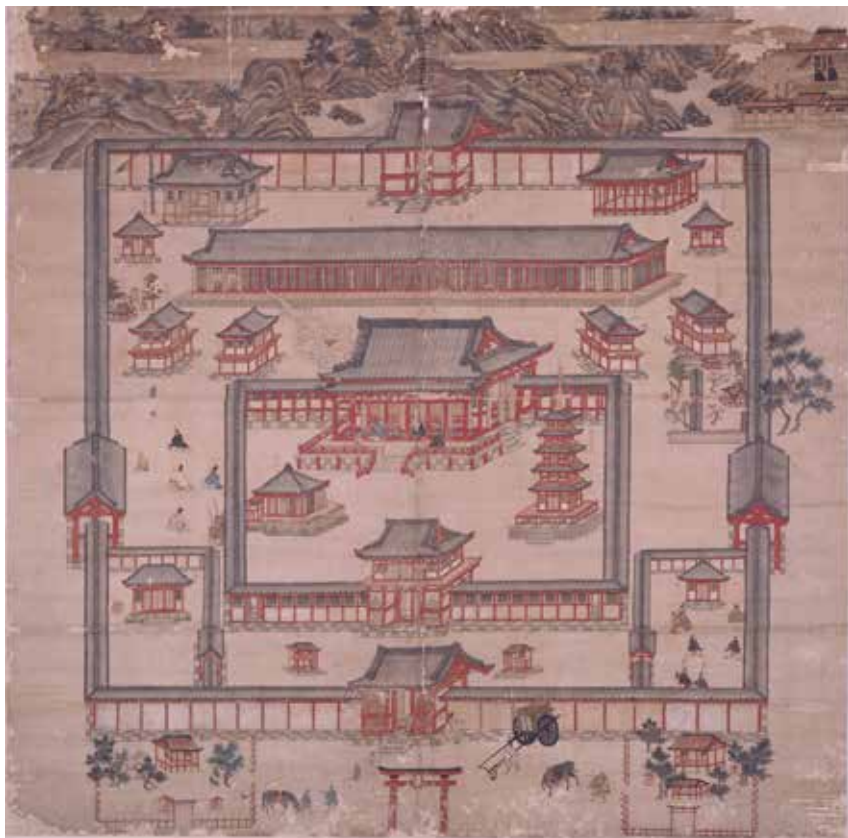
▲観世音寺絵図

164.3cmの大きさの絵で、中央には講堂を中心として金堂と五重塔が向かい合い、講堂の北には巨大な僧房が描かれているほか、南は三蹟に数えられる小野道風筆とされる扁額