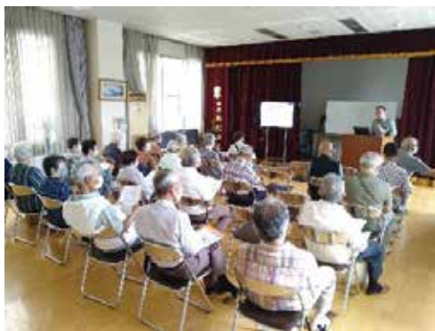
▲自治会での出前防犯講座