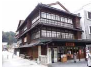
過去の受賞作品「甘木屋」

本市では「百年後も『古都太宰府の風景』が映えるまち」をキーワードに景観まちづくりを進めています。太宰府らしい素敵な景観を教えてください。自薦・他薦は問いません。皆さんの応募お待ちしております。 選考・表彰 市民人気投票と専門家による選考をして優秀作品を決定し、優秀作品の所有者・設計者を表彰します。 過去の受賞作品 第1回だざいふ景観大賞「甘木屋」