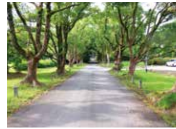
第7回市長賞「観世音寺のクス並木」