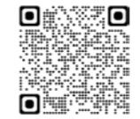
手話奉仕員養成講座申込フォーム