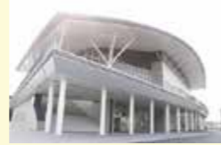
とびうめアリーナ

回答: 開催場所を「プラム・カルコア太宰府」から「とびうめアリーナ」に変更する検討をしており、ステージ等の設営が必要になるためです。