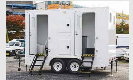
トイレトレーラー