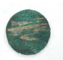
菖蒲浦古墳から出土した布に包まれた鏡