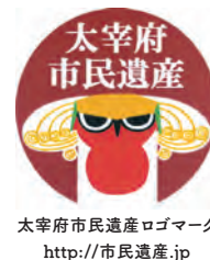
太宰府市民遺産ロゴマーク http://市民遺産.jp