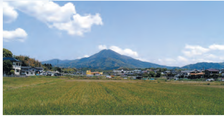
高雄の田園から望む宝満山