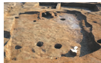
竪穴住居跡(吉ヶ浦遺跡)