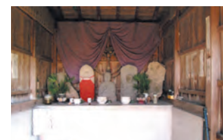
筑紫四国第十二番札所