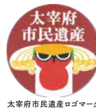
太宰府市民遺産ロゴマーク