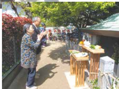
春祭り (平成25年4月15日)