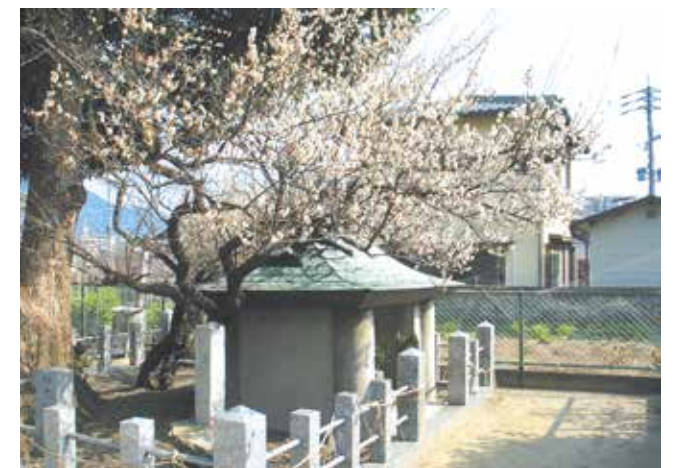
現在の六弁の梅と隈麿の墓